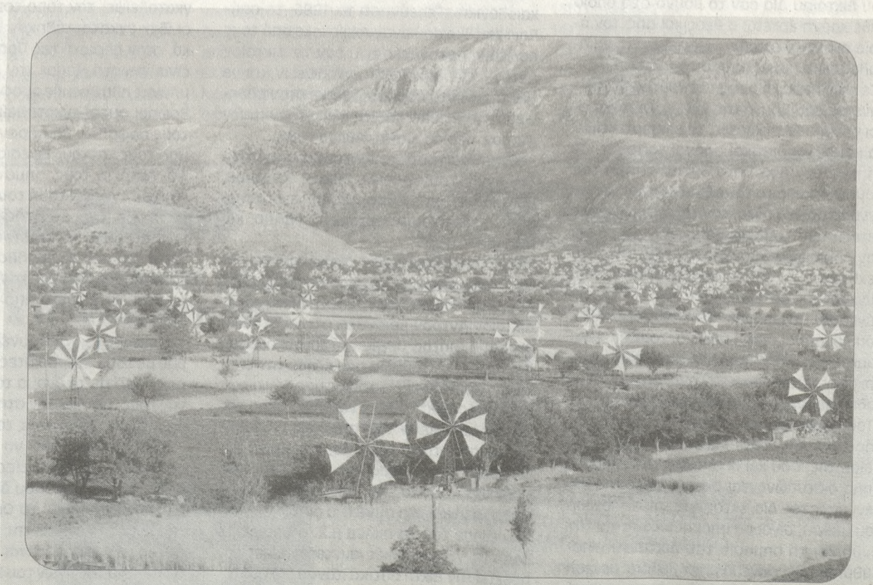
Αυτές οι εικόνες πρέπει να αναβιώσουν