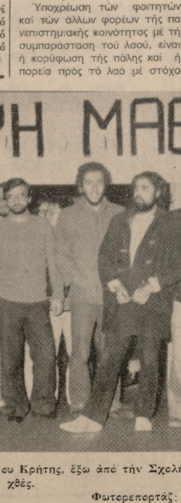
Φοιτητές του Μαθηματικού Τμήματος του Πανεπιστημίου Κρήτης, έξω από την Σχολή τους, την έπειά κατέλαβαν από χθες.