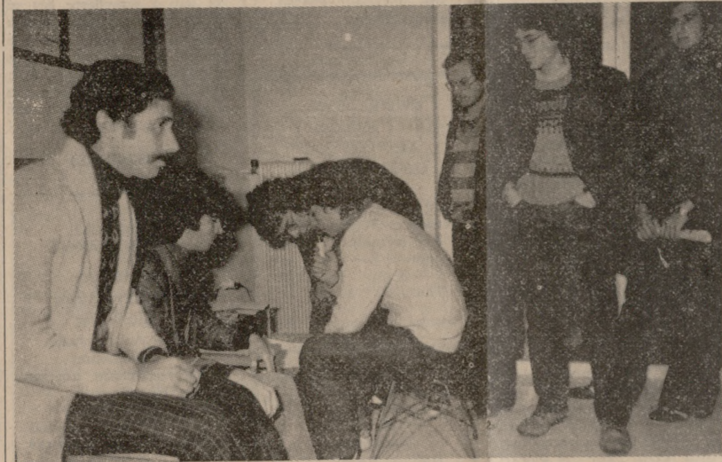
Φοιτητές της Φυσικομαθηματικής Σχολής του Πανεπιστημίου Κρήτης, έμφανίζουν συνθήματα από τα γραφεία του Πανεπιστημίου τα οποία έχουν καταλάβει.