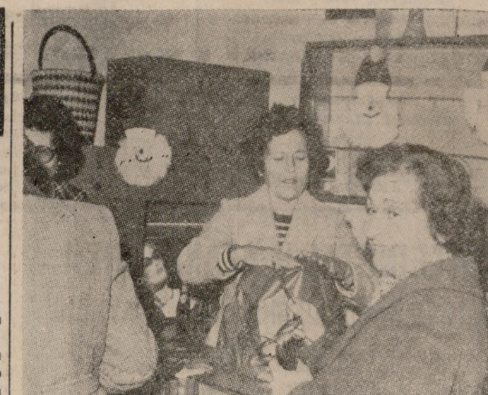
'Ενα στιγμιότυπο ἀπὸ τό «Παζάρι τῶν Ὀδηγῶν», στίδ ὅποιο πυληθήσαν διάφορα εἶδη φτιαγμένα ἀπὸ κυρίες τοῦ Τοπι- κοῦ Συμβουλίου, γιά ἐνίσχυση τοῦ Ταμείου τῶν Ὀδηγῶν. Φωτορεπορτάζ: Β. ΔΡΟΣΟΣ τηλ. 221830

'Ενα πλήρες γεύμα ἢ δείπνο στό ΣΑΦΑΡΙ μόνο μέ 185 δρχ. Τηλ. 233-133