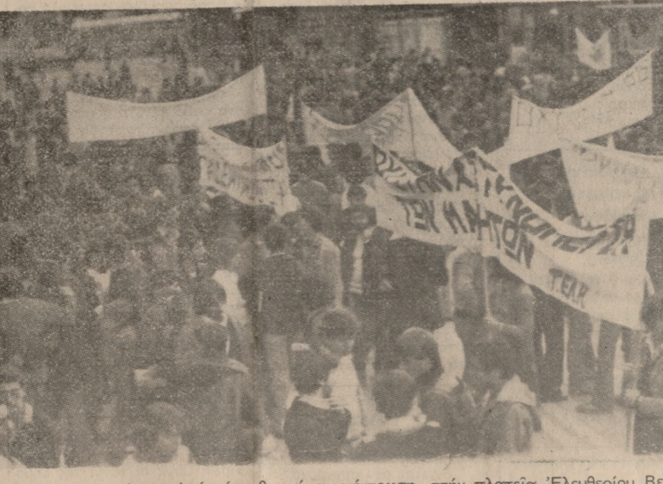
Ένα στιγμιότυπο από την χθεσινή συγκέντρωση, στην πλατεία Έλευθερίου Βενιζέλου, για την κατάργηση του Ν. 815. Φωτορεπορτάζ: Β. ΔΡΟΣΟΣ 221830

Όλοι οι όμιλητές στην συγκέντρωση, έκφρασαν ένάντια στο Ν. 815 συμπεριφέροντα τον άγωνα των φοιτητών της Φ.Μ. Σ. Ηρακλείου για την κατάργηση του. Διότι όπως από την όλη του συμπέροια φάνηκε — είπον — δεν είναι ύπερ των