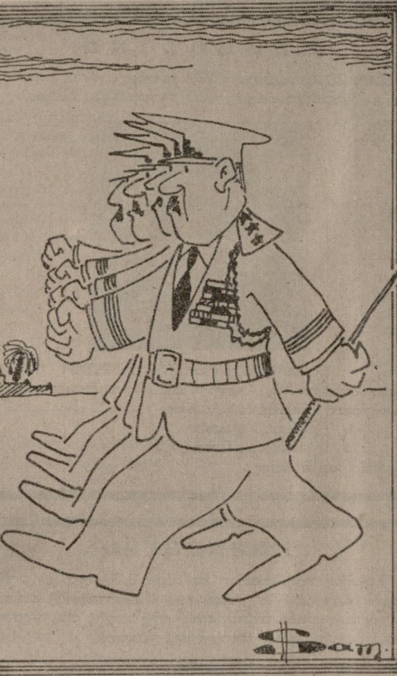
«Τεσσερις στρατηγοί κινών και πάλι πόλεμο στο μακρινό τ' Ιράν...» (Τού ΒΑΓΓΕΛΗ ΣΑΜΑΡΑΚΗ)