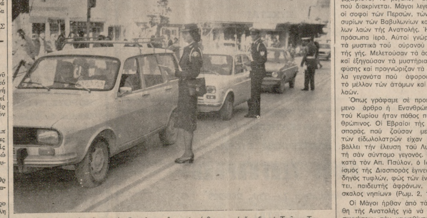
«Γιορτές χωρίς αίμα στην ασφαλτο» είναι τό σύνθημα πού έφριξε τό Τμήμα Τροχαίας Κινήσεως Ηρακλείου, όργανα του όποιου μέ έπικεφαλής τόν έκτελούντα χρέη Διοικητού Άνθυποπυραρχο κ. Νικ. Λουκά, άρχισαν μιá μεγάλη έκστρατεία, γιά τήν ύλοποίηση τού συνθήματος αυτό. Στα πλαίσια της έκστρατείας αυτής χθές τό πρωί όργανα της Τροχαίας διένειμαν αυτοκόλλητα και άλλα έντυπα στους οδηγούς, μαζί μέ τίς εύχές τους γιά τόν καινούριο χρόνο. Σχετικό είναι και τό παραπάνω σιγμύοτυπο.