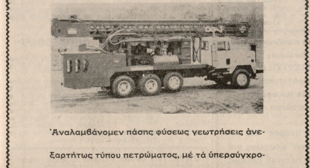
'Αναλαμβάνομε πάσης φύσεως γεωτρήσεις άνεξαρτήτως τύπου πετρώματος, με τά ύπερσύγχρονα γεωτρήματα INGERSOLL - RAND.

'Αντιπρόσωπος ΕΜΜ. ΣΥΝΤΙΧΑΚΗΣ Μαστραχή 6 - 'Ηράκλειο Τηλ. 285761 - 288157