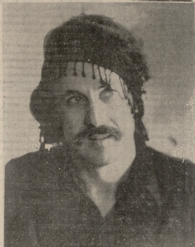
Ο ΤΡΩΒΑΛΟΥΡΟΣ ΤΗΣ ΚΡΗΤΗΣ

ση με τήν φροντίδα τού Έσπουλιτιστικού Συλλόγου.