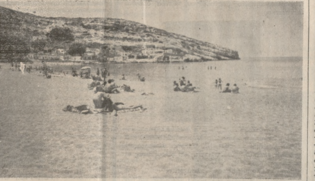
ΜΑΤΑΛΑ: Μιά από τις νότιες άκτές πού κινδυνεύει να θεωρηθεί κακόφημη.