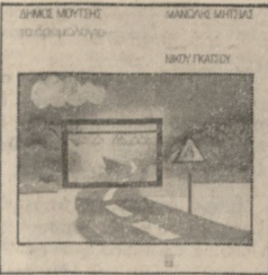
Τό βιβλίο «1922», «Άση μίνας», «Ποιός έχει δάσκαλο να μου δώσει», «Στό Άγιονόρος», «Μαυρήνη τίς άγάπης ώρας», «Ελλάδα - Έλλάδα», «Έραγού δι του φυλακισμένου και άλλ.

● ΚΑΙ τό ανέκδοτο τής στήλης: Σ' ένα αυθημερόμο στάθμό γίνεται πυρετώδης προετοιμασία γιατί τά περσιόσε ό άπομαγός που έπαθερούσε όλοους τούς σταθμούς. Ό σταθμός είχε διατεθεί τόν κλειδούχο να καθαρίσει τόν Σταθμό και έπειδή είχαν πάσει πάνω στίς γραμμές λάδια τούδωσε έντολή να καθαρίσει με στυαί καλά τίς γραμμές. Πέρασε ό άπομαγός να έμεινε ευχαριστήμενος, αλλά ό κλειδούχος είχε έξασφα νισθεί. Ύστερα από τρεις μέρες ό Σταθμάχος έθαβε τήλε γράφημα που έλεγε: