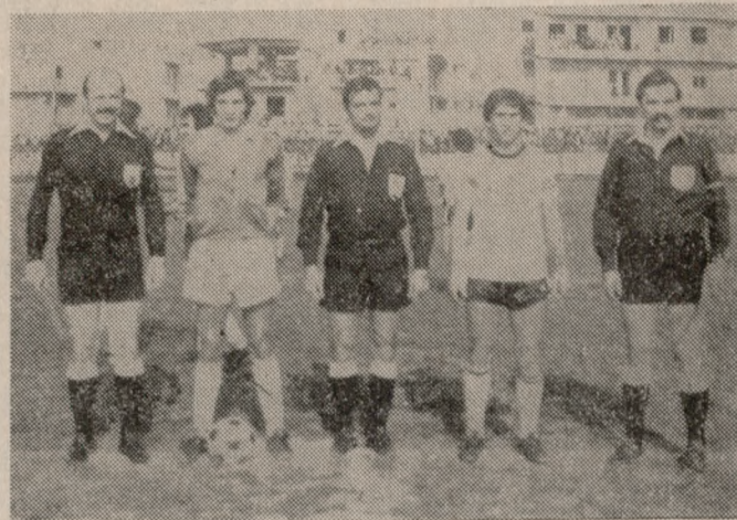
‘Η καθιερωμένη φωτογραφία λίγο πριν από την έναρξη του αγώνα: ‘Ο διαιτητής, οι έπιπέτες γρημμών και οι αρχηγοί των δύο ομάδων.

ΣΤΟΝ αγώνα ΟΦΗ — Γιάννινα κέρδησαν 3.543 εισιτήρια και εισπραχθηκε 622.100 δρχ. ενώ στον αγώνα Αχαρνάϊκ — Ηρόδοτος τα εισιτήρια ήταν 536 και οι εισπράξεις 49.880 δραχμές.