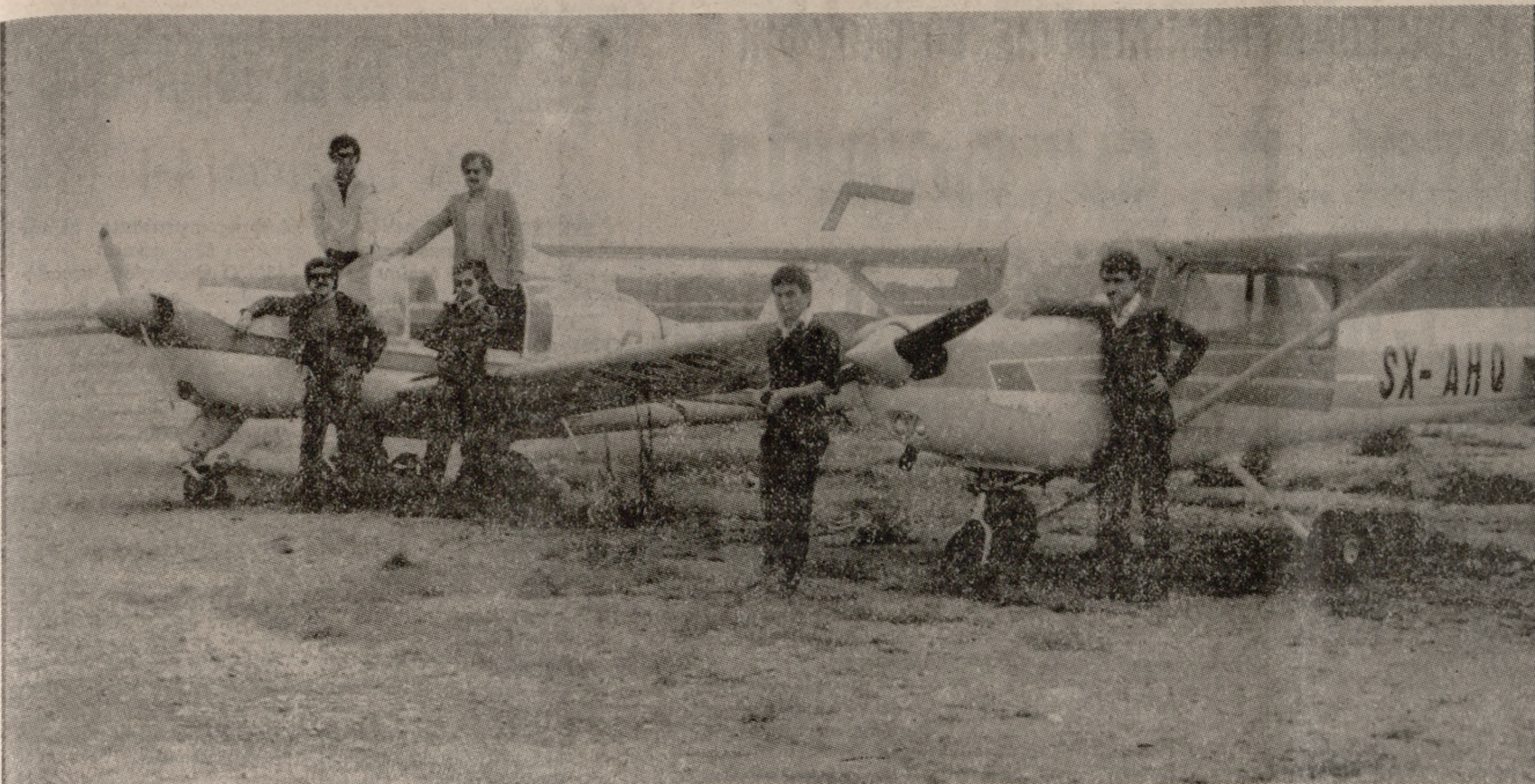
Χειριστές και εκπαιδευόμενοι της 'Αερολέσχης 'Ηρακλείου, άγκυρά με τα αεροπλάνα της Λέσχης.