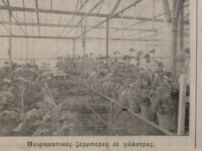
Πειραματικές ζέρμερες σε γλάστρες.

Ο κ. Δοξιάδης τόβαλε πείσμα, άμειν και καλά, να γίνει ο σωτήρας μας. Στις πύλες των 'Ελλήνων κλητών, όπως ο κ. Κωνσταντίνος είναι ο σωτήρας των 'Ελλήνων αυτοκλήτων. Αύξηση στή βενζίνη, αύξηση στο φόρο, και ζωνά αύξηση στή βενζίνη και πάλι διπλασιασμό του φόρου, και της έσφορας, και νότο το άποτέλεσμα. 'Αραγμένο στους δρόμους άμύλητα κι άκύνουα, και που παντός, άκίνητα, τα αυτοκίνητα. 'Όσο για καινούρια, ούτε λόγος να γίνεται...'