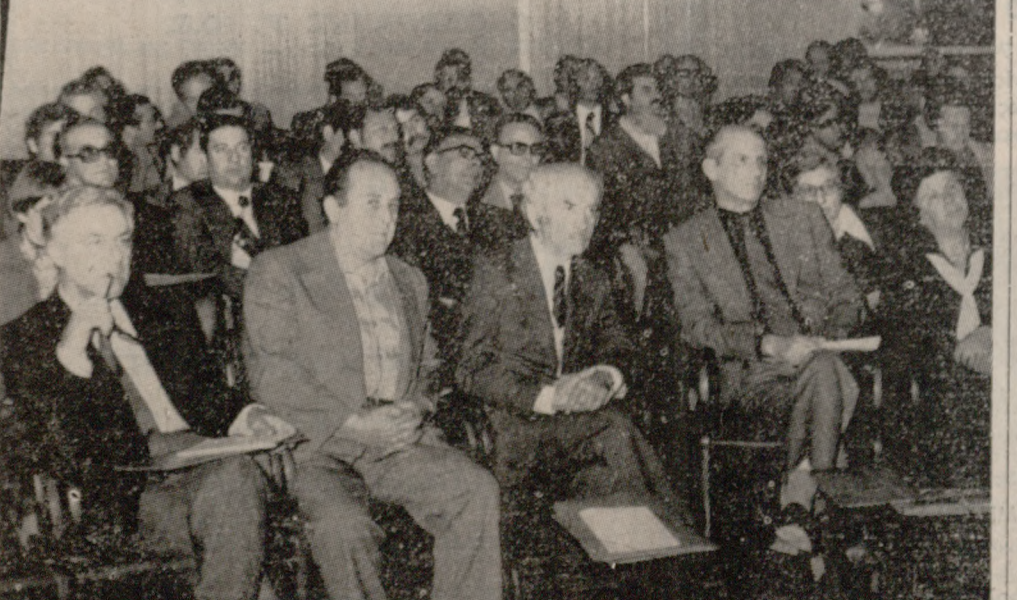
ΑΡΧΙΣΑΝ χθες και συνεχίζονται σήμερα, στην αίθουσα συσκέψεων...