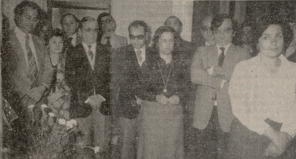
Από τα χθεσινά εγκαίνια του Σπιτιού του Συλλόγου «Φίλοι του Παιδιού».