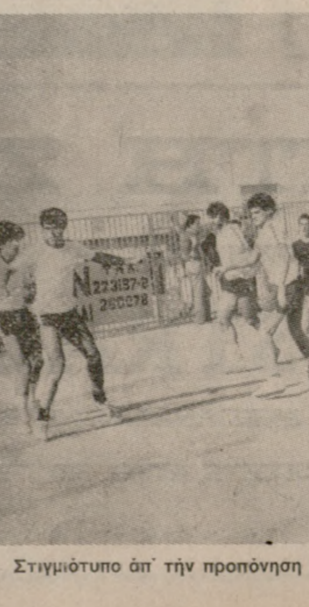
Στημύκτοπο όπ τήν προπόνηση τών παικτιών τού Ο.Φ.Η. όπ γηπέδου τού Π.Ο.Α.

οικητικού Συμβουλίου και φιλάθλων, θά γίνει άγιασμός, μετά τό πέρασ τού όποιου θά μιλήσουν πρώτος τούς ποδοσφαιριστές ο πρόεδρος τού 'Ηρόδοτου κ. Πολυίωτης και ο πρόπονητής κ. Πιτιχούτης.