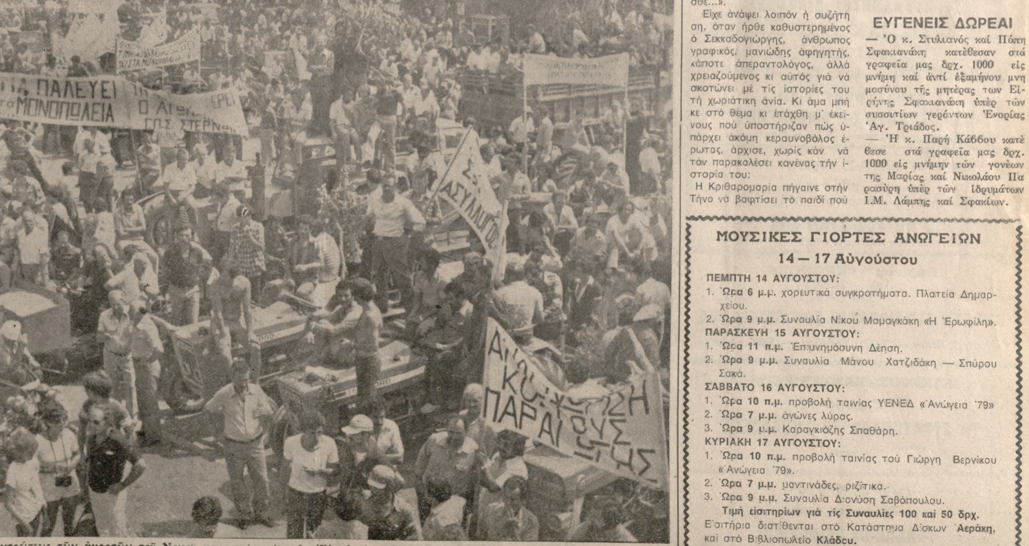
Ένα τμήμα της μεγάλης συγκεντρώσεως των άγροτών του Νομού μας, στην πλατεία 'Ελευθερίας. Μένουν άμετακίνητοι στις θέσεις τους μέχρι να έπιστρέψει από την 'Αθήνα η τετραμελής έπιτροπή.

Την Παρασκευή 15 Αύγουστου άρχίσαμε στο πάρκο Γεωργιάδη της πόλης μας οι έξι δηλώσεις του δου Φεστιβάλ της ΚΝΕ και του «ΟΛΗΓΗΤΗΣ».