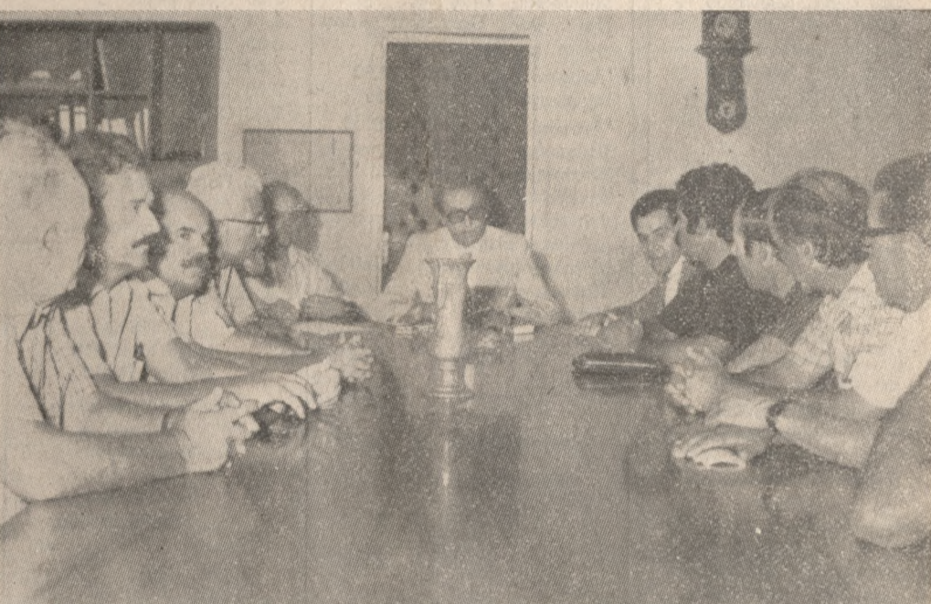
Στιγμιότυπο από την σύσκεψη που πραγματοποιήθηκε στην Νομαρχία, με συμμετοχή της Συντονιστικής 'Επιτροπής και των Βουλευτών.

ΤΟΣΟ η πορεία, με πάσης φύσεως τροχοφόρα, όσο και η συγκέντρωση, έπεσαν και τις πλέον αισιόδοξες προβλέψεις. ΣΤΙΣ 10.30 π.μ. άρχισαν να φτάνουν στην πλατεία αγροφόρα από την λεωφόρο Δημοκρατίας (καυνογίους δρόμος) προς την πλατεία 'Ελευθερίας. 'Αγροτικά αυτοκίνητα, τρακτέρ, ογκοτακτά, τρικύκλα, με μαζικές ομάδες άρχισαν να φεμίζουν την πλατεία.