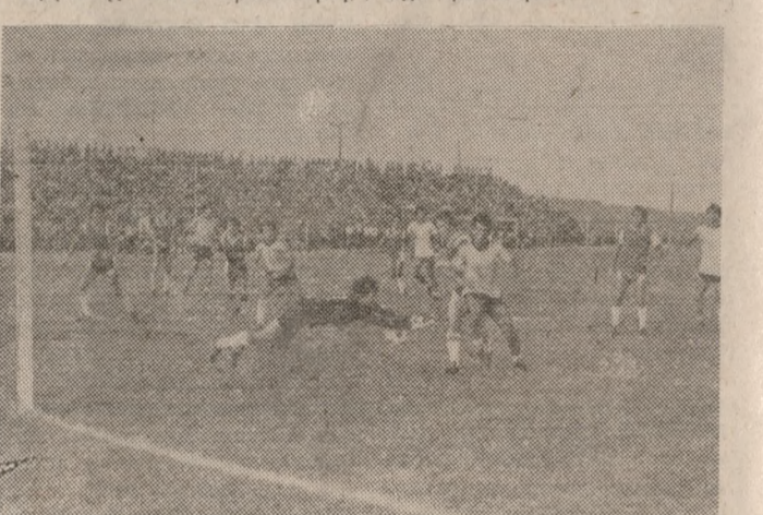
Ή μάπλτα έχει «κοντράρει» στο πόδι του Ζήση και σε λίγο θα καταλήξει στα δίχτυα του Ήρόδοτου. Ο Πανακάκης προσπαθεί, αλλά δέν θα μπερδέσει να κρατήσει τη μάπλτα.

ΔΕΝ χρησιμοποιήθηκε ο Όρε γιατί άπομείσε δικαιολογημένα στην Αθήνα (για να φέρει την οικογένειά του) και δέν είχε προπονηθεί.