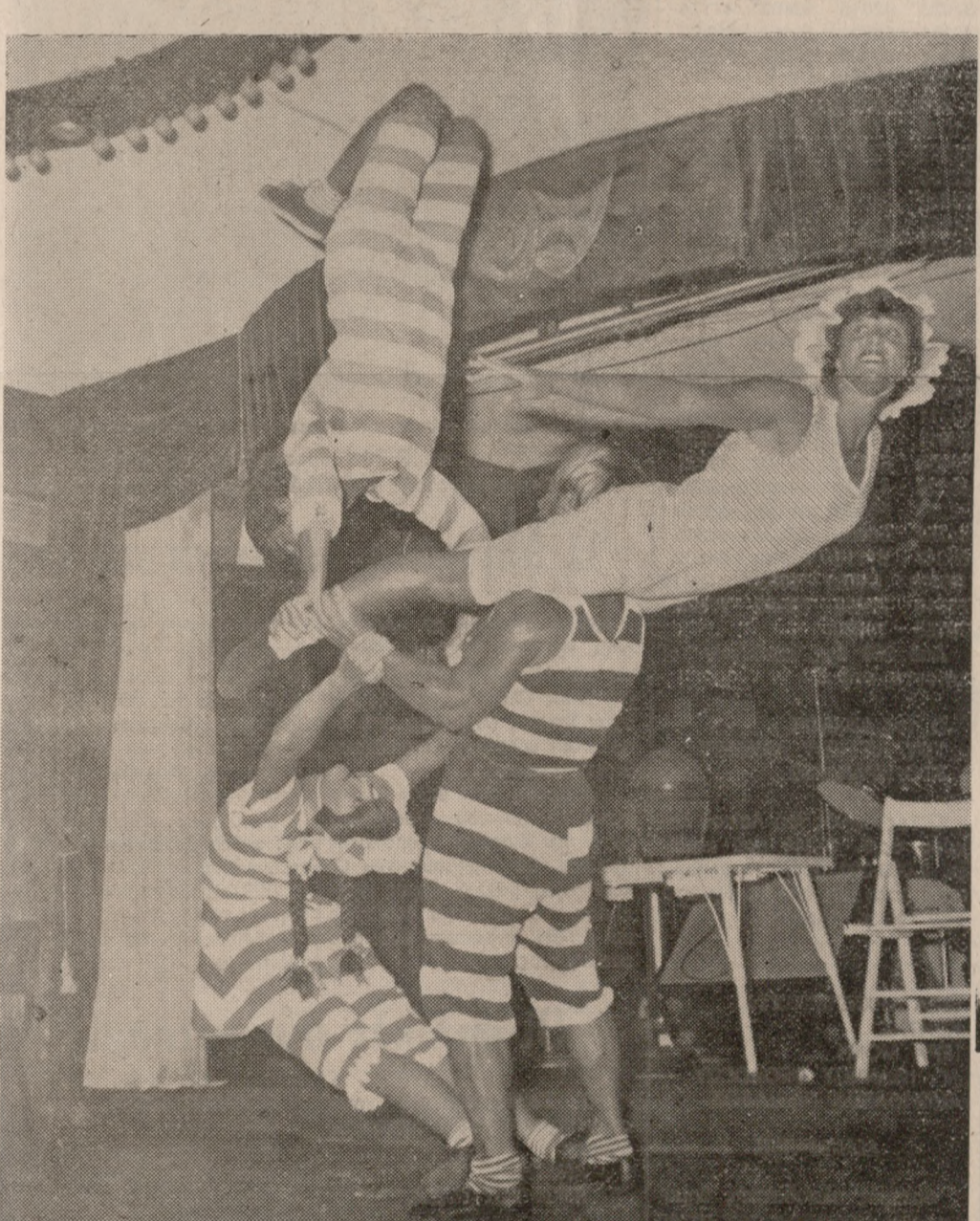
« THE LOONES » ΑΠΟ ΤΑ ΜΕΓΑΛΥΤΕΡΑ SHOW ΤΟΥ ΚΟΣΜΟΥ

Μιά από τις πολλές Άτραξιόν του Προγράμμάτος μας