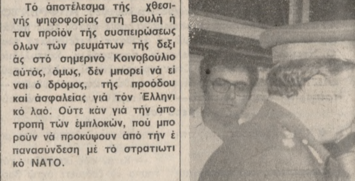
Μετά από παραμονή δέκα ημερών στην Κρήτη άναχώρησε χθές έπιστρέφων στην Γερμανία ο πρόεδρος του Σοσιαλδημοκρατικού Κόμματος της Δυτ. Γερμανίας κ. Βίλλυ Μπράντ. Το στιγμιότυπο είναι από την άναχώρησή του, διακρίνεται δε ο Δήμαρχος κ. Καρέλλης ο οποίος παραδίνει άναμνηστικό δώρο στον κ. Μπράντ.

Η δήλωση με την οποία έκλεισε τη διαδικασία ο πρώτος πουργός κ. Ράλλης άσφαλώς δέ μπορεί, παρ άνα όφειλεται σε φραστικό όλισθημα. Γιατί είναι άδιανοήτο να δέχεται η Ελλάδα διαπραγματεύσεις και συνομίλιες με την Τουρκία, όταν ταυτόχρονα δηλώνεται ότι δι εκδίκησης έχει μόνο η Τουρκία εν ή Ελλάδα δεν έχει. Άλλά τέτοια όλισθηματα δεν παύουν να έχουν βαρείς άσθενές συ νέπεις. Το περιστατικό είναι ένδεικτικό της νοοτροπίας που καταδικάσαμε στη Βουλή.