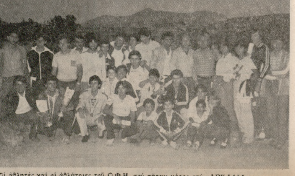
Οι άθλητές και οι άθλήτριες τού Ο.Φ.Η. που πήραν μέρος στα «ΑΡΚΑΔΙΑ», μαζί με τούς προπονητές τους κ.κ. Δραμουντζή και Κυριακίδη.

Μία προσφορά έκπληξη στην κομψή Γυναίκα Πλούσιο δείπνο — χορός και θέαμα Μόδας άπο τὰ φινετσάτα μανεκέν τού Οίκου ΡΙΚΑΣ ΔΙΑΛΥΝΑ και τόν χορευτή Μάικ Νικολάτο Τήν Τετάρτη 19 Νοεμβρίου στις 9.30' τού βράδυ στο «ΑΤΛΑΝΤΙΣ» Μία βραδιά που δεν πρέπει να χάσετε. RESERVATION τηλ. 286455 πρωινές ώρες και 283522 άπογευματινές