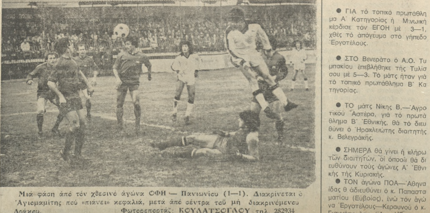
Μια φάση από τόν χθεσινό άγώνα ΟΦΗ—Πανιωνίου (1—1). Διακρίνεται ο Άγιωματίτης που «πιάνει» κεφαλιά, μετά άπό σέντρα τού μη διακρινόμενου