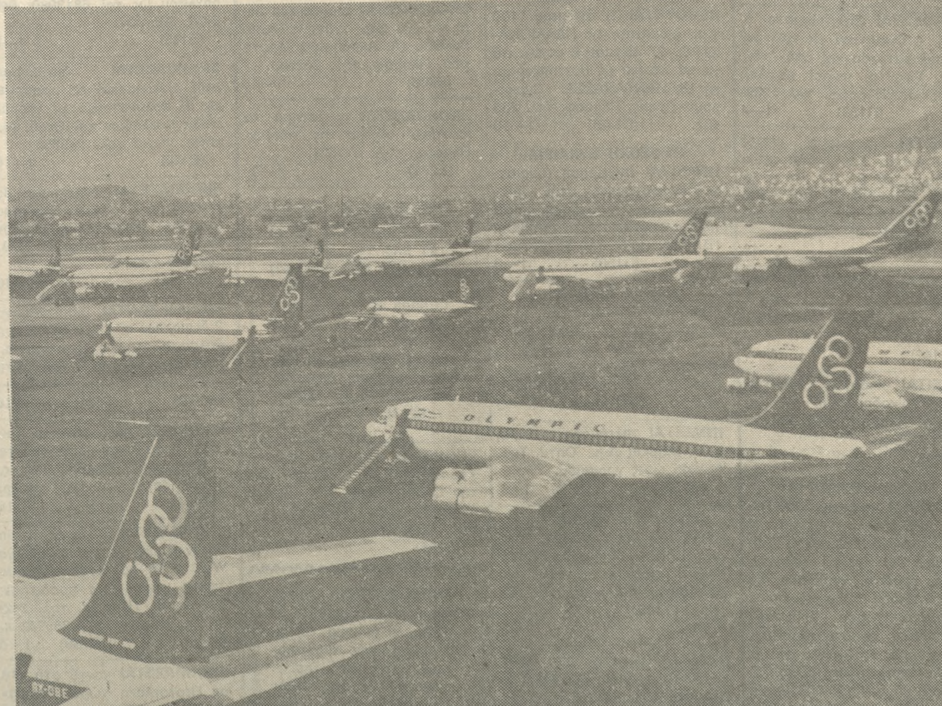
Ο αεροπορικός στόλος της «ΟΛΥΜΠΙΑΚΗΣ» θεωρείται από άποψης ποιότητας και συντηρήσεως από τους καλύτερους του κόσμου. Διαθέτει εσωτερικούς χώρους σχεδιασμένους με φροντίδα και με ανακαινιστές και εύρυχωρες πωλημένες, 32 αεροσκάφη (αερατζί — BOEING — για πωλιώνικα) άπαρτίζουν τον αεροπορικό στόλο της «ΟΛΥΜΠΙΑΚΗΣ ΑΕΡΟΠΟΡΙΑΣ»

— Με τα επιτεύγματα της ζωής της των 24 ετών και προπάντων τα πρόσφατα των τελευταίων πέντε χρόνων, αλλά και με τον προγραμματισμό και τις προβλέψεις της για το μέλλον, δεν μπορεί κανείς παρά να αισιοδοξεί για την μελλοντική πορεία της Εθνικής μας Αεροπορικής Εταιρίας στο χώρο των αεροπορικών μεταφορών. Η περσοπτική της μικρής αεροπορικής εταιρίας που ήταν στα πρώτα βήματα της η Όλυμπιακή, πέρασε από πολλά χρόνια τώρα και η Όλυμπιακή μας, η Όλυμπιακή του Ελληνικού Λαού, πετά ψηλά, όσο ψηλά βρίσκονται και οι άλλες αεροπορικές εταιρίες μεγάλων και πλούσιων χωρών.