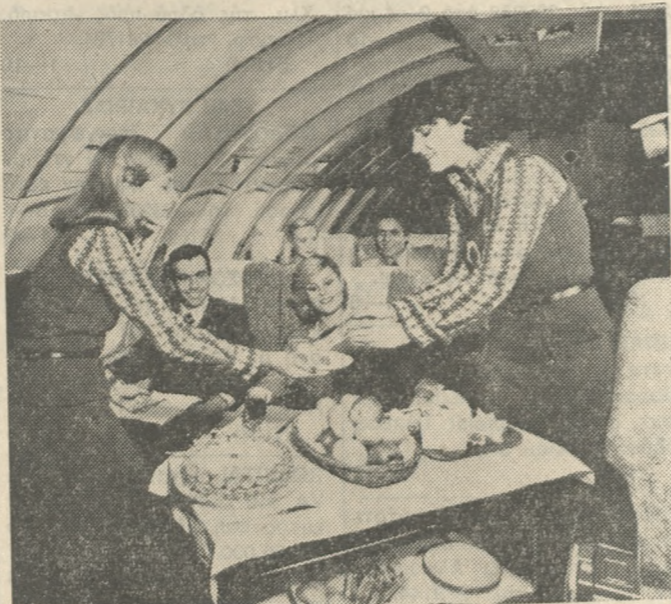
Οι επιβάτες της πρώτης θέσης για τις πτήσεις Ευρώπης και υπερηπειρωτικές, απολαμβάνουν τα καλύτερα μενού και την άψογη περιποίηση των αεροσυνοδών.

Η ολοένα αναπτυσσόμενη δραστηριότητα της ΤΑΕ προκαλεί το ενδιαφέρον και το 1947 το Επικρατικό Ταμείο Στρατού, Ναυτικού, Αεροπορίας και Δη-