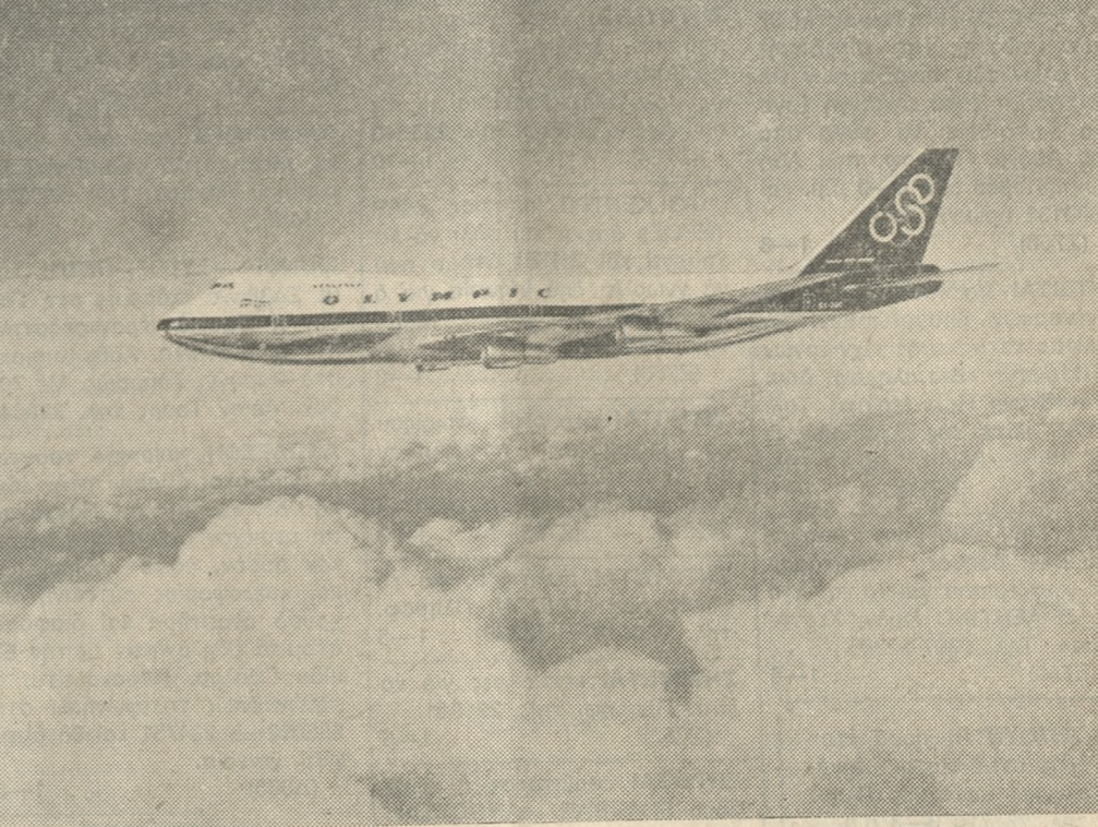
Αεροπλάνο ΤΖΑΜΠΟ BOEING 747 της «ΟΛΥΜΠΙΑΚΗΣ» θεωρείται η «Βασίλισσα των αεθίων». Έχει μήκος 71 μ. και ύψος 19,33 μ. Πετάει σε ύψος 9.450 μ. — 12.000 μ. με ταχύτητα 945 χλμ. την ώρα. Παιρνει 389 επιβάτες (12 στη πρώτη θέση) και εμπορεύματα 175 τόννων.

— Στις 3 Δεκεμβρίου 1976 προστίθεται και η Μελβούρνη