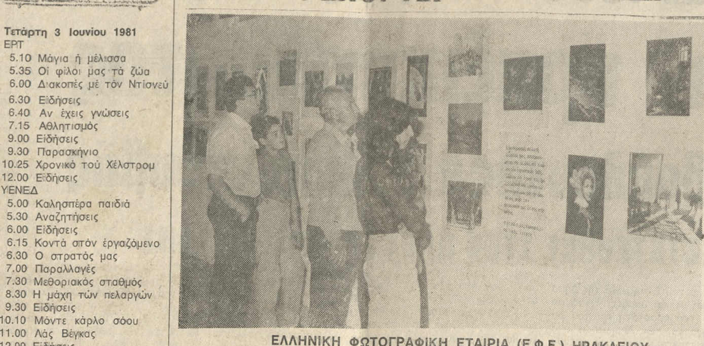
ΕΛΛΗΝΙΚΗ ΦΩΤΟΓΡΑΦΙΚΗ ΕΤΑΙΡΙΑ (Ε.Φ.Ε.) ΗΡΑΚΛΕΙΟΥ

Τετάρτη 3 Ιουνίου 1981 ΕΡΤ 5.10 Μάγια η μέλισσα 5.35 Οι φίλοι μας τ'ά ζώα 6.00 Διακοπές με τον Ντίανου 6.30 Ειδήσεις 6.40 Αν έχεις γνώσεις 7.15 Αθλητισμός 9.00 Ειδήσεις 9.30 Παρασκήνιο 10.25 Χρονικό του Χέλστρουμ 12.00 Ειδήσεις ΥΕΝΕΔ 5.00 Καλησπέρα παιδιά 5.30 Αναζητήσεις 6.00 Ειδήσεις 6.15 Κοιτά στον εργαζόμενο 6.30 Ο στρατός μας 7.00 Παραλογές 7.30 Μεθοριακός σταθμός 8.30 Η μάχη τών πελαργών 9.30 Ειδήσεις 10.10 Μόντε κάρλο σούου 11.00 Λας Βέγκας 12.00 Ειδήσεις