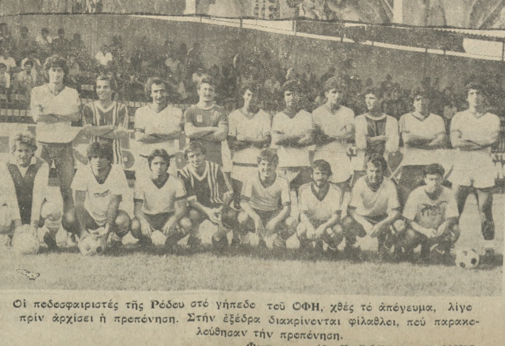
Οι ποδοσφαιριστές τής Ρόδου στο γήπεδο τού ΟΦΗ, χέος τό άπέγευμα, λίγο πριν άρχισι ή προπόνηση. Στήν εξέδρα διακρίνονται φιλάθλοι, πού παρακα- λούθησαν τήν προπόνηση.