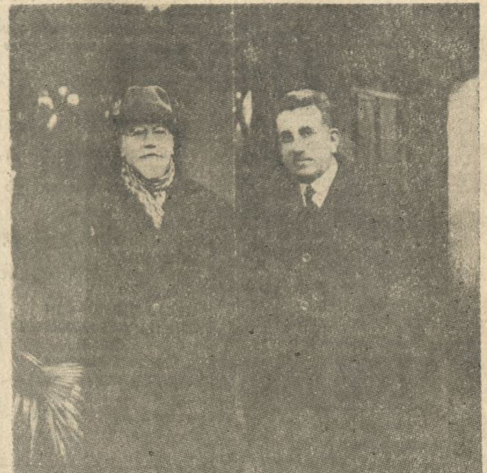
Ο Δήμος Ηρακλείου, τιμή ιδιαίτερα σήμερα πού είναι ή μέρα των 62 Μαρτύρων, τόν μάρτυρα Δήμαρχο Ηρακλείου πού πλήρωσε με τή ζωή του τή συνέπεια του σε χρέος. Τόν ΜΗΝΑ ΓΕΩΡΓΙΑΔΗ. Ηταν ένας από τους 62 εκκινούντες πού τευχρικόσαν στο Γάζι έκείνη τόν Έσθη Μάρτυρες, σε θηριώδη έρωμέ της κτηνώδους θεωρίας της «αυλογυικής εδύθη» πού έαρχρησαν οι Χιτλερικοί Δολοφόνει. Ο Δήμος σήμερα στή θέση της φεβρημένης μαρμαρίνης προτομής του σε άφιερμένο στή μνήμη του Πάρκο, έστησε νέα χαλίμη και δά κάρπει σε τελετή τή άποκαλυπτήρια της. Η φωτογραφία μας, είναι ένα ιστορικό ντοκουμέντο πού είχε τήν καλωσύνη να μās δώσει ο κ. Νίκος Κωνσταντινίδης. Είναι ένα φωτογραφικό στιγμιότυπο με τόν Κρητικό γίγαντα Έθναρχη της Έλλάδας Έλευθέριο Βενιζέλο, και τόν άειμνηστο Μηνά Γεωργιάδη, πού ο Έθναρχης τόν έτιμα με τή φιλία του.