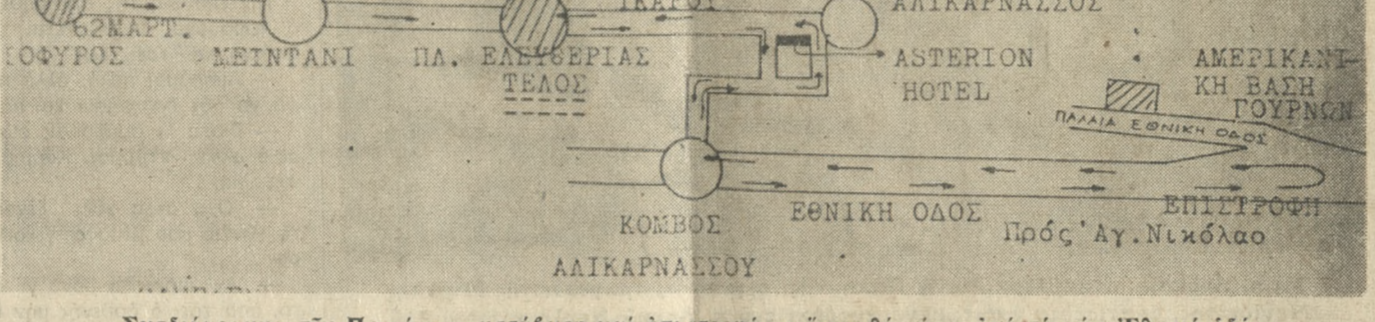
Σχεδιάγραμμα τίς Πορείας — μετάβαση και έπιτροπή — όπως θά γίνει από τί νέα 'Εθνική οδό.

Παρ' έλο που τό θέμα τίς καταργήσως των ξένων Βάσεων, είναι ύπόθεση ένδική, και δικαιολογημένα ή ύπαρξη τους δημιουργεί έντονα αίσθήματα όργης, ή πορεία πρέπει να γίνει, και θά γίνει, με άπόλυτο σεβασμό στους νόμους, γιά να ύπεγραμμισθεί και με τίς ένδεδλωση αυτή ή Κρητική γενναίωφισια, αλλά και ή άνευχερή άξίωση να φύγουν οι ξένες βάσεις. 'Η πορεία θά είναι ειρηνική έπος και ή άρμόδια 'Επιτροπή έχει τονίσει και έπαναλαμβάνει με άνακείνωσή τίς που έκδεδχε χθές. Στήν άνακείνωση τίς 'Επιτροπής, άναφέρονται τά έξής: να που κάνει ολόκληρος ό Ελληνικός Λαός γιά τό δώδεμο των Ξένων Βάσεων από τί χώρα μας. Πιστεύει ότι ή ύπαρξη τους άποτελεί κίνδυνο γιά τίς ειρήνη στην περιοχή μας γι αυτό και παίρνει μέρος στην σημερινή πορεία και καλεί τά μέλη του να συμμετάσχουν. Γιά τό Διοικ. Συμβούλιο Ο Πρόεδρος Νικ. Βεργιάκης Ο Γραμματέας Λευτ. Πλυμιάκης Η Κυβέρνηση, παρά τίς άναστολή των διαπραγματεύσεων γιά τίς 'Αμερικάνικες βάσεις κάτω από τί Λοική πίεση, διατηρεί τό σημερινό καθεστώς υπό τέλεις κι εξετήρησης. Τό Διοικητικό Συμβούλιο τίς Συνεργατικής ΜΗΧΑΝΙΚΩΝ Ν. Ηρακλείου, έκφράζοντας τά αισθήματα των συναδέλφων γιά συνέχιση και ένταση του άντιβασικού άγώνα, χαιρετίζει τίς άποφάσεις τίς Ν.Ε. κατά των Ξένων Βάσεων γιά πορεία στην 'Αμερικάνικη Βάση Γουρνών, σήμερο στις 6.30 τό άπόγευμα και