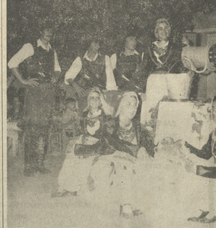
Έπιτυχία σημείως η εκδήλωση για τον κληδόνα, πού άργάνωσε σε Κρητικό Κέντρο ό Σύλλογος των Φίλων της Κρητικής Μουσικής. Τό παραπάνω στιγμιότυπο είναι από την εκδήλωση αυτή. Φωτορεπορτάζ: Ν. ΜΑΛΤΕΖΑΚΗΣ τηλ. 289261