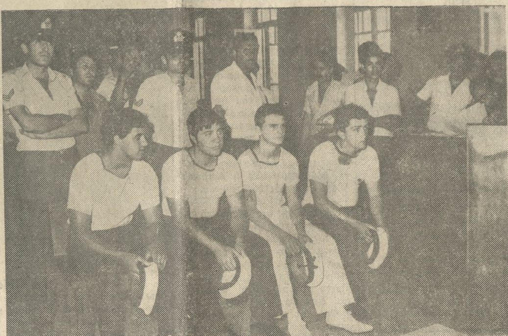
Στο εδωλίο του κατηγορουμένου οι θρασείς ύβριστές των Ηρακλειωτών.

Αποτέλεσμα ήταν να τραυματιστούν δύο ακόμη άτομα