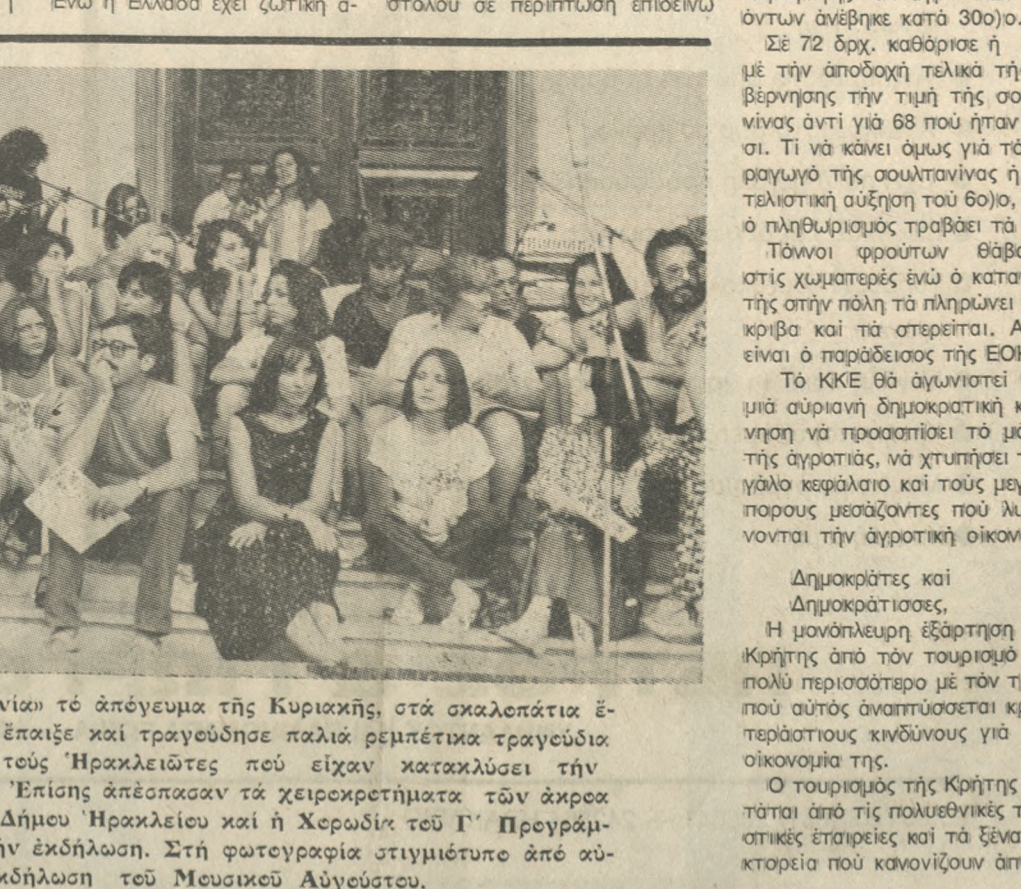
Η «Όπισθεδρική Κομπανία» τό άπόγευμα της Κυριακής, στα σκαλεπάτια έξω από τον Άγιο Μάρκο, έπαίξε και τραγούδησε παλιά ρεμπέτικα τραγούδια και χειροκροτήθηκε άπό τους 'Ηρακλειώτες που είχαν κατακλύσει την πλατεία των Λιονταριών. Έπίσης άπέσασαν τά χειροκροτήματα των άρκρα των ή Μικτή Χερσάδια του Δήμου 'Ηρακλείου και ή Χερσάδια του Γ' Πρσγράμματος που συμμετείχαν στην εκδήλωση. Στη φωτογραφία στυμνίετρε άπό αυτή την εκδήλωση του Μουσικού Αύγουστου.

Φωτορεπορτάζ: ΚΟΥΛΑΤΣΟΓΛΟΥ· τηλ. 282934 — 242262