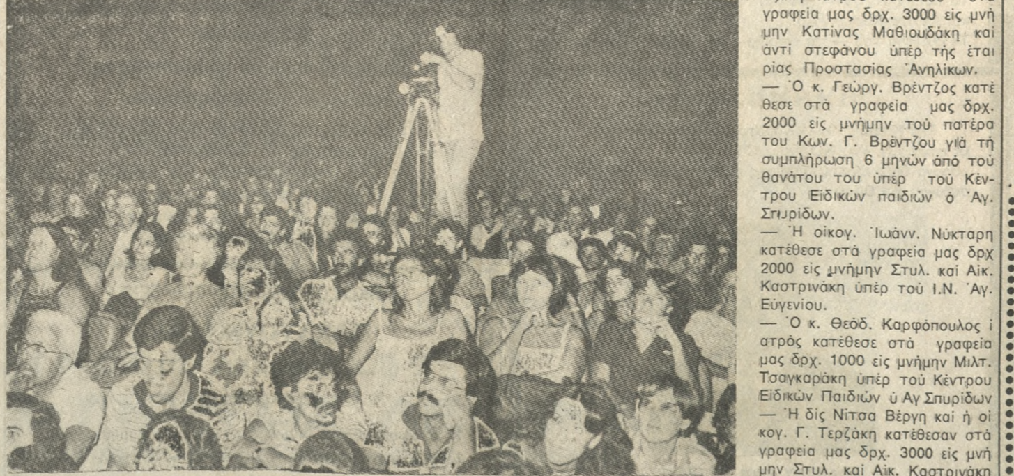
Κατάμεστο από κόσμο το κηποθέατρο «Ν. Καζαντζάκη» τό βράδυ της Δευτέ- ρας στην συναυλία του Διονύση Σαβδόπουλου. Έπ' εύχαρία θα λέγαμε ότι έφ' όσον ύπάρχουν διάφορες τιμές εισιτηρίων θα έπρεπε να ύπάρχουν και άριθμημένες θέσει για να άποφεύγεται ή ταλαιπωρία των θεατών. Στην φωτογραφία μέρες από τον μεγάλο άρμά των άκρατών...