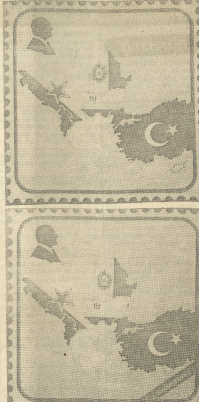
Τήν μακέτα τής έκθεσης κυκλοφόρησαν οι Τούρκοι που έδειχνε καί τή Κύπρο. (Έπάνω). Κατόπιν όμως άπό διαμαρτυρίες τών Έλλήνων φιλοτελιστών οι όποιοι έλαβαν μέρος στήν έκθεση διορθώθηκε ή μακέτα καί σκέπασαν τή Κύπρο με τή λέξη ΒΑΛΚΑΝΦΙΛΙΑ VIII (Κάτω).