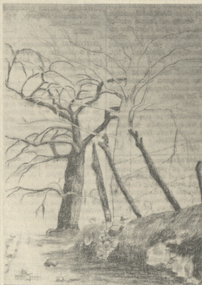
Γενικά τα έργα της τείνουν σε μια αναλυτική και συνθετική κατεύθυνση.

Έτσι και η ρεαλιστική εκφορά της χαρακτηρίζουν τα σχέδια της σε μολύβι και κάρβουνο.