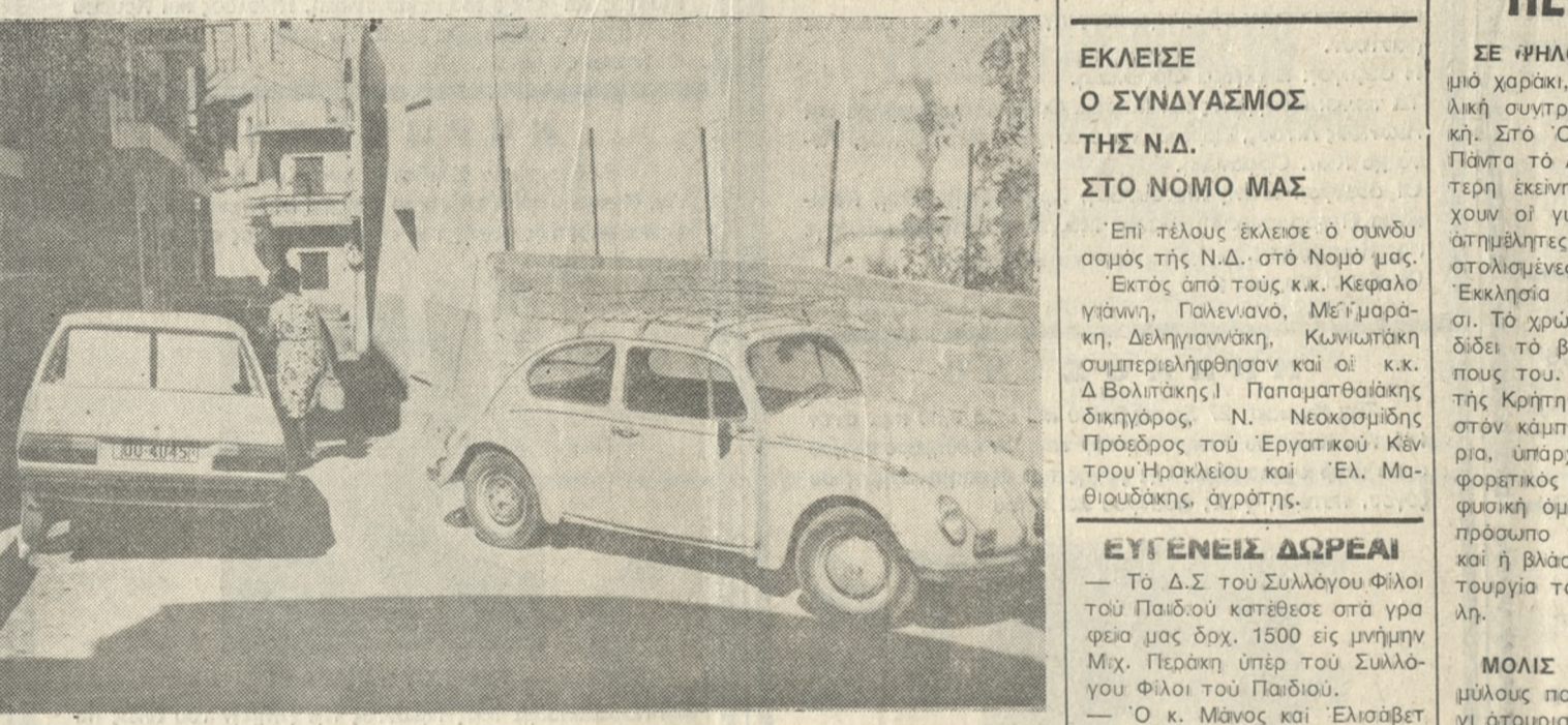
'Απερίσκεπτα παρκάρουμε τά άυτοκίνητά μας με άποτέλεσμα να κλείνουμε τους στενούς δρόμους.

Σίγουρα, όμως έχει δικίωμα ο πεζός πού λέει ότι με νοιάζει άμείνα; 'Εγώ θέλω να κάνω πή κατάσταση; Άς την δούμε μέσα από μερικά νούμερα: • Στην οδό Ανδρόνικου ένα τών 50 θέσεων. • Στην πλατ. Αγ. Αικατερίνης 50 θέσεις. • Στην οδό Ανδρόνικου ένα τών 50 θέσεων. • Στην πλατ. Αγ. Αικατερίνης 50 θέσεις.