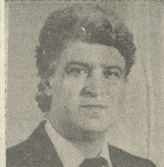
του τόπου μας. Πιστεύω στη ΔΗΜΟΚΡΑΤΙΑ αυτή που πάνω απ' όλα βάζει την ανθρώπινη αξιοπρέπεια και

Αγαπητοί μου, συμπολίτη και συμπολίτισσα, ανεξάρτητα από τις πολιτικές προτιμήσεις και σκέψεις σου, ως μου επιτρέψεις με την επιστολή μου αυτή, να σε πληροφορήσω γιατί ζητώ να με τιμήσεις με την ψήφο σου και να σου πω ποιος είναι ο βασικός άρχος και τα πιστεύω μου.