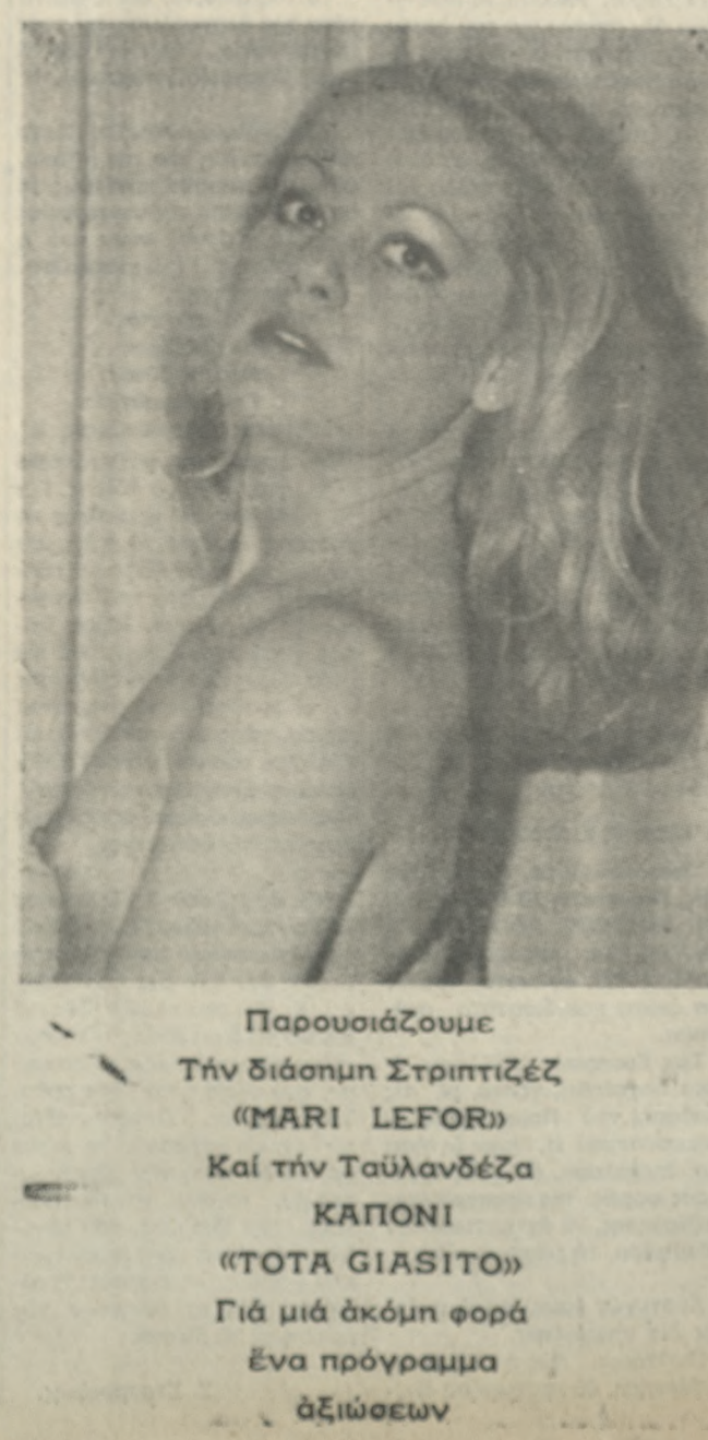
Παρουσιάζουμε Τήν Διάσημη Στριπτιζέζ «MARI LEFOR»