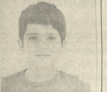
ΕΚΚΛΗΣΗ ΓΙΑ ΒΟΗΘΕΙΑ

Αναλυτικά τα αποτελέσματα της εβδομάδας: — Δος Γύρος: Τζαροδής — Παπαδόκης 0-1, Τουρνουά νιάρας — Νικηφόρος 1)2-1)2, Μπαλζάκης — Στρατάκης 1-0, Παπαγιαννάκης — Μαρκακίς 0-1. — Δος Γύρος: Μαρκακίς — Τζαροδής διακοπή, Παπαδόκης — Τουρνουά νιάρας 0-1, Νικηφόρος — Μπαλζάκης 0-1, Στρατάκης — Παπαγιαννάκης 0-1.