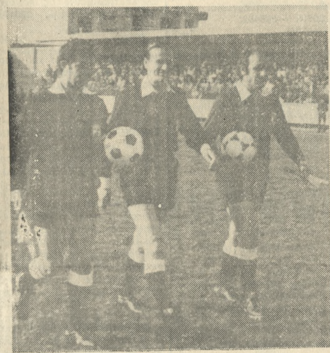
Το τρίο της διαιτησίας, του μάτς ΟΦΗ—ΠΑΟ