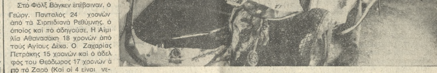
Το μερξίο Η.Ι. 4577 Φόλξ - Βάγκεν. Άσπρημένο σε μία μάντρα με τη σκεπή του κομμένη άαν να ήταν κακάκι κενάρεας, και τις μύες να γλύφουν ό,τι άπέμει νε από έφτά άνθρώπους: το ξεραμένο αίμα τους...