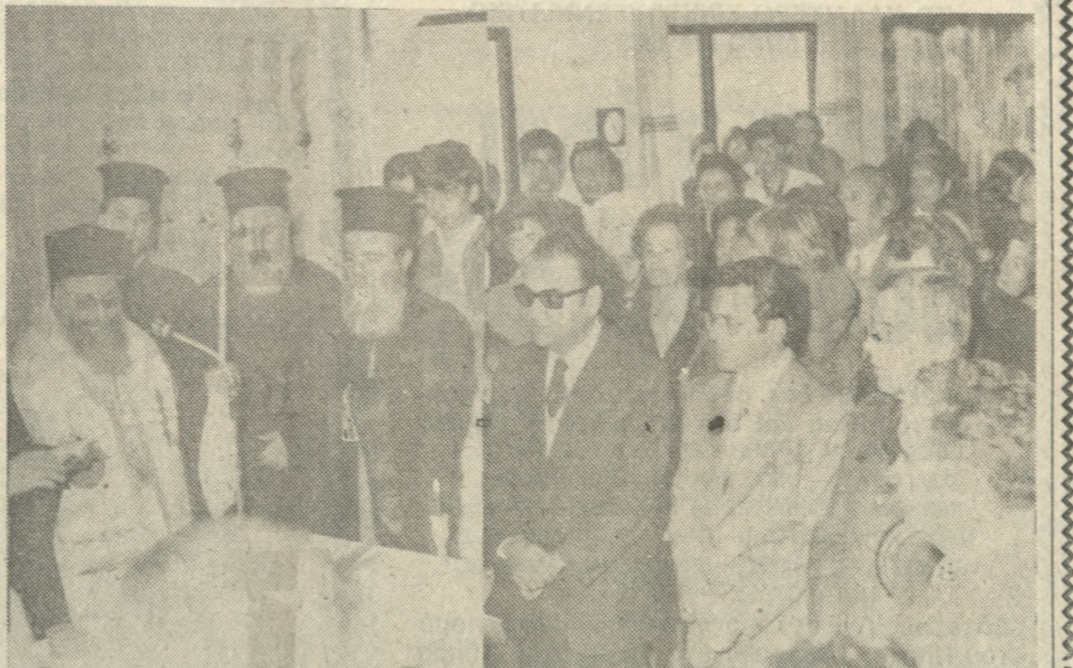
Ένα στιγμιότυπο από τά έργακία του Κέντρου Νεότητας Άγίου Τίτου, που έρίσκαται στην έδω Έπιμενίδου καί έχει σαν άκοινούς στόχους τήν άσπασή τής Έκκλησίας στις καθύστερες ανάγκες τής πνευματικής άναζητήσεως καί καλλιέργειας των νέων καί τήν παρηχί στεύς νέους ψυχαγωγίας ποιότητας σε πολιτισμένο περιβάλλον, που θα σέβεται την προσωπικότητά τους. Φωτοεπιμάρτες: ΚΟΥΛΑΓΙΩΣ Τηλ. 282934

ΒΑΣΙΛΙΚΗ ΑΓΙΟΥ ΜΑΡΚΟΥ Κυριακή 20 Δεκεμβρίου ώρα 8,30' π.μ. Ο ΔΗΜΟΣ ΗΡΑΚΛΕΙΟΥ με τή συμεργασία του Βρετανικού Συμβουλίου ΠΑΡΟΥΣΙΑΖΕΙ τή Χορωδία Κολιγού ST JOHN του Καίμπριτζ σε μία Συναυλία με έργα κλασικά καί σύγχρονα. Εισιτήρια άρχ. 200, φοιτητικά - μαθητικά άρχ. 100, πουλούνται στο Δέμο καί τή Βασιλική Άγίου Μάρκου.