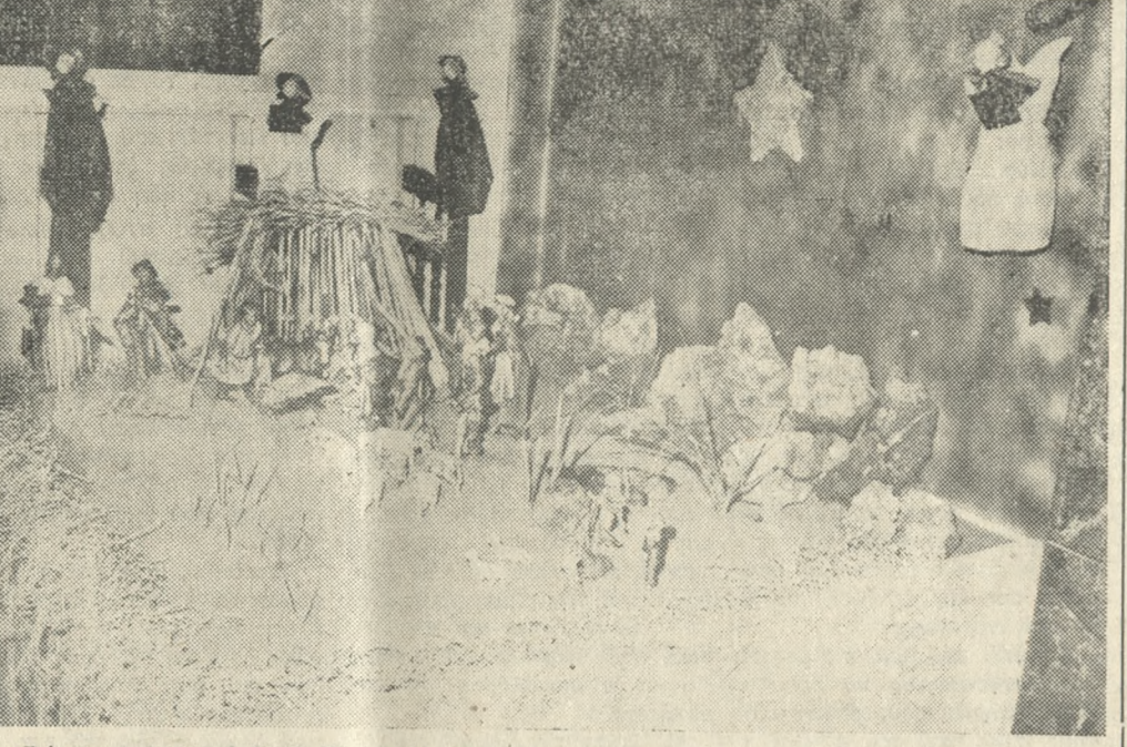
Φάτνη στην Καθολική Έκκλησία τού Ηρακλείου Καλλιτεχνία τής κ. Μείπλετον Μαδανιάν. Ώρες επίσκεψης 6—8 μ.μ. από τίς 25-12-81 μέχρι τίς 6-1-1982.