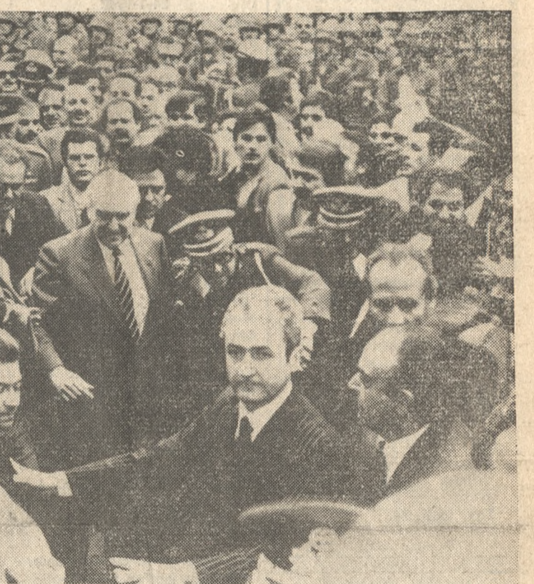
Χιλιάδες λαοὺ ἐπέφυλαξαν ἐνθουσιάζοντες ὑποδοχὴν στὸν Πρωθυπουργὸν κ. Ἀνδρέα Παπανδρέου. Ἐνθουσιάζοντες ἀπὸ τὸν λαὸν τῆς Κρήτης. Ἐμπρὸς στὸν ἀγῶνα γιὰ τὴν οἰκοδόμησιν τῆς πατρίδος μᾶς.

Υποσχέθηκα στὸ λαὸ τοῦ Ἡρακλείου, στὸ λαὸ τῆς Κρήτης ὅτι ἡ πρώτη μου ἐπίσημη ἐπίσκεψις στὸν ἑλληνικὸν χῶρον θὰ εἶναι τὸ Ἡράκλειο ποὺ βρισκῶμαι στὴν πρωτοπορία τοῦ ἀγῶνα γιὰ μιὰ νέα Ἑλλάδα. Ἀγαπητὴ Δῆμαρχε, Μὰς συνδέσθουν παλιὸ ἀγῶνας καὶ αὐτὸ ἀκριβῶς ξαναφῆρνε στὴν ἀντιμῆση μὲ ἄλλους μεγάλους ἀγῶνες γιὰ τὴν Δημοκρατία. Ἀγῶνας στοὺς οποίους ἡ Κρήτις ὡπὸς τὴν ἴδιαν ἡμέραν, τὸ πρῶσινον νῆσὸν ἴστανε πρωτοπορῶ. Εἶναι βασικὸς θεμέλιος λίθος τοῦ κινήματος μὲ ὅτι μόνον ἡ ἐνεργὸς ὀχι ἀπλῶς συμπαράστασις ἀλλὰ ἀποκαίνιστον καὶ συμπαράστασις τοῦ λαοῦ μὲ νὰ ἀνοίξῃ ὀριστικὰ τὸν δρόμο γιὰ τὴν ἀλλαγὴ γιὰ κείνη τὴν Ἑλλάδα ποὺ ἴσταν ἡμεῖς τὸ ἄνεργο λαὸν μᾶς. Μιὰ Ἑλλάδα ἐνὶ καὶ περήφανη, μιὰ Ἑλλάδα κοινὴ νικητὴ δίκαιη, μιὰ Ἑλλάδα γνήσια δημοκρατικὴ. Μετὰ τὸν σὺντομο χαιρετισμὸν τοῦ πρῶσινου ἀποκαίνιστον ἀπὸν Ἑλληνικὸν λαὸν ἐνα πρόγραμμα γιὰ τὰ ἐπόμενα 4 χρόνια. Αὐτὸ τὸ πρόγραμμα ὕστερα ἀπὸ 91 ἀκριβῶς ἡμέρας ἀπὸ τὴν ἀναλήψιν τῆς κυβερνήσεως, εἰσῆλθε ἡ ποσοστὸ μὲ νὰ ὀλοκληρῶσιν.