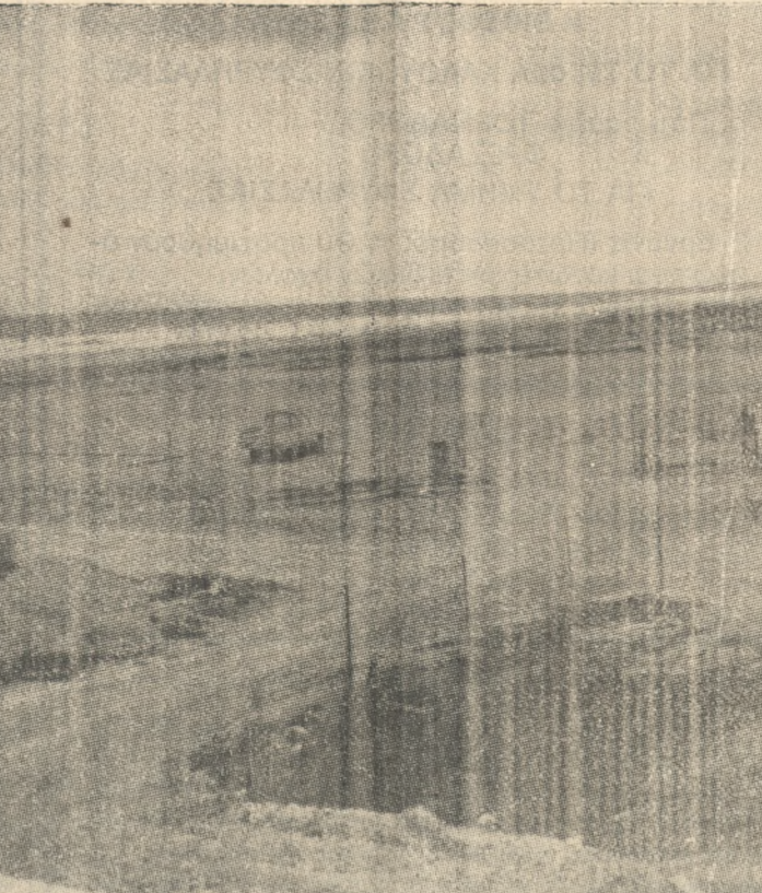
Ο ιστορικός ΕΓΟΝ αποκτά τή δική του στέγη. Σε λίγο ή δημοφιλής ομάδα, με τίς τόσες περγαμηνές, θα παίξει στό δικό της γήπεδο και θα μπει νά έάλει ύψηλούς στέχους και νά γίνει τό πανίσχυρο συγκρότημα τού παρελθόντος. "Όπως μάς διαβεβαίωσαν οί υπεύθυνοι τού Συλλόγου θα έξασφαλιστούν άντετες προεβάζεις προς τήν θάλασσα γιά τήν έξυμπρέτηση τών λεωφεμένων.