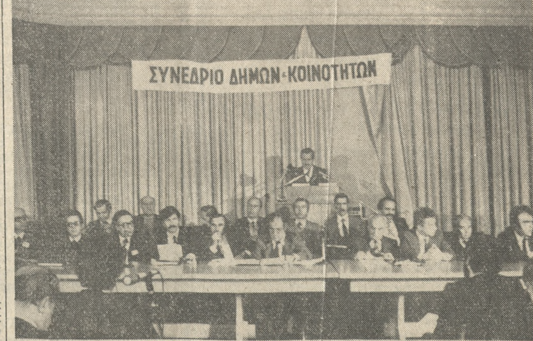
Ένα στιγμιότυπο από τó Συνέδριο Δήμων και Κοινοτήτων στην αίθουσα τού Ε.Β.Ε.Η. Στό έθμα ό Δήμαρχος Άθηνών κ. Μπέης.

«Ε, τότε, λάλιε, έίπε! ΕΞΩΚΡΪΣΤΗ ζεστασία και ή πράμα με μωρά να τó έδωσε ή παρουσία τών Δημάρχων και Κοινοτάρχων τής Κύπρου, Έλευθερικός δέν τού υπέδειξε τόν κίνδυνο που διέτρεχε τó τρυφερό δεντράκι να σπάσει από τó βάρος και τó χοντροπυθόνα τού. Και όταν κάποιος φίλος κέντρος έκίνησε από τó άλλο άκρο τής πλατείας και πέρασε με χίλια βάσανα τó πλήθος για να τó σπάσει, τó άποκρίθη: