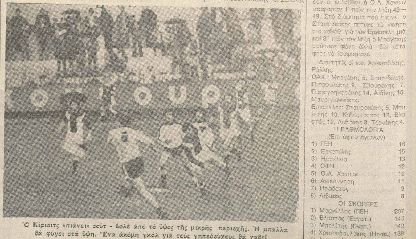
Ο Κίριτσις «πιάνει» σουτ - θελε από τέ ύψος της μικρής περιοχής. Η μπάλλα δε φύγει στα ύψη. Ένα ακόμη γκέλ για τους γηπεδούχους θα χαθεί.