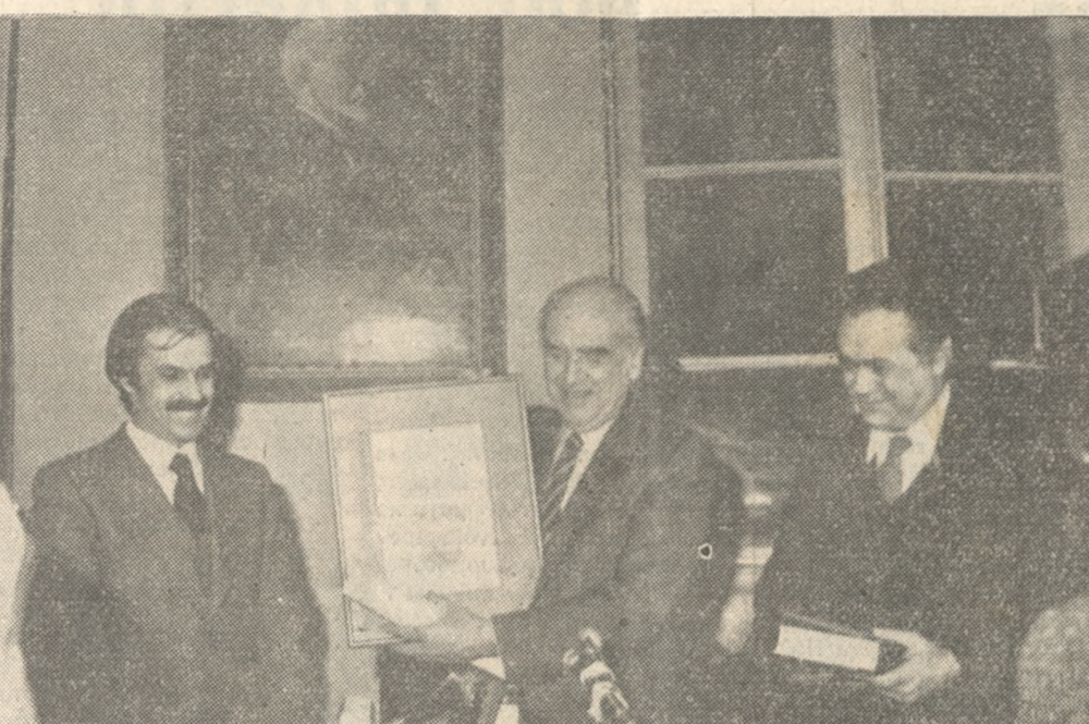
Ο Πρωθυπουργός κ. Ανδρέας Παπανδρέου επιδεικνύει τó χειρόγραφο τού Έλευθερίου Βενιζέλου. Άριστερα ό κ. Ματθαίου και δεξιά ό κ. Καρέλλης.