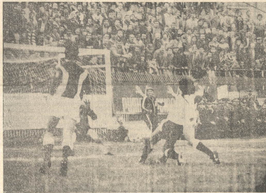
Ο "Ορε έχει σεντάρι, αλλά ή μπάλλα θα φύγει ελάχιστα έξω. Μιά ευκαιρία γιά τόν ΟΦΗ χάνεται.

ΤΟ ΜΑΤΣ ΑΡΧΙΖΕΙ ΣΤΙΣ 2.45' ακριβώς ο Πατρι- νός διαιτητής κ. Μεσσαλάς (Κα- τασκιώρης — Βαγγελίτσος) κάλε- σε τούς αντίπαλους στον αγωνι- στικό χώρο που παρατάχθηκαν μπροστά του με τίς ακόλουθες συνθέσεις: ΟΦΗ: Λαφτιάς, Μουμάκας, Βλά- χος, Τασσάπουλος, Αγοσταμπίτης Παπαθεοδώρου, Χριστοφής, Κι- ρισπίς, Όσε, Κοσωνάκης (52' Α- λεξίου) Πασσάς (46 Κορυγιώτης). ΛΑΡΙΣΑ: Πήλιπας, Δράμυλης, Πατσιμπούρας, Αργυρούλης, Γκαλιτσός, Παραφύσσας, Κου- τιάς, (89' Μητσιμπόνας) Γκάλαν- τας, Βαλαώρας (81' Πολυζώπου- λος), Ανδρεαδής, Μαλουμίδης. ΣΤΟ 3ο μόλις λεπτό δημιουρ- γείται ή πρώτη ευκαιρία γιά τόν ΟΦΗ. Ο Χριστοφής μέσα στην περιοχή δίνει τή μπάλλα στον ά- μαρκαριστό Κίσιους που καθυ- στερεί νά σουτάρει και δίνει τήν ευκαιρία στους άμυντικούς νά ά- ποκορύψουν. ΟΤΑΝ χάνει γκόλ, δέχεται Συνέχεια στή σελ. 6