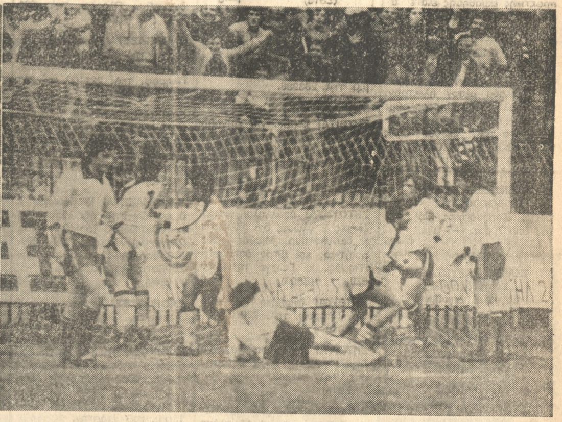
Τό γκολ τού ΟΦΗ σε δύο πλάνα: Άριστερά ή μπάλλα έχει πάρει ύψος, μετά άπό τό ψηλοκρεμαστό σιρτά τού Χριστοφί, που δέν φαίνεται στή φωτογραφία. Σε λίγο έα καταλήξει στό δίχτυ, χωρίς να ηπερέσει ο Δουλλάς. Δεξιά τό γκολ έχει έπιτευχθεί και οι παίκτες τού ΟΦΗ πανηγυρίζουν, ενώ οι φιλοξενούμενοι είναι περίλυποι.