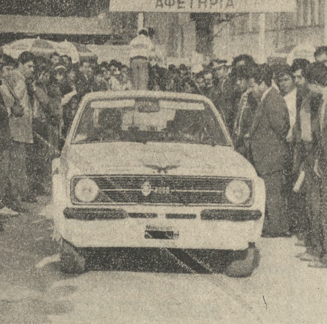
Ένα στιγμιότυπο από το 4ο Ράλλυ Κρήτης που συγκέντρωσε το ενδιαφέρον των φίλων του θεάματος.