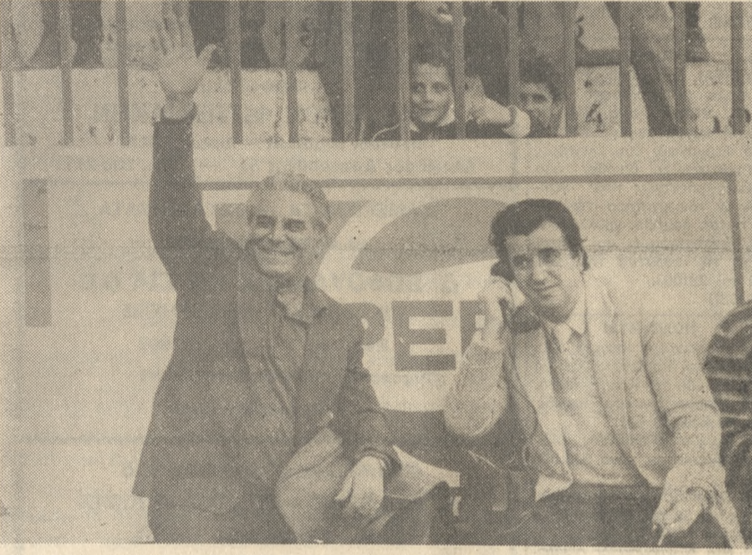
Τό μάτς ΟΦΗ — Καστοριάς παρακολούθησε και ο διακεκριμένος ηθοποιός ΣΠΥΡΟΣ ΚΑΛΟΓΗΡΟΥ, ο οποίος έρέθηκε από Ηράκλειο γιά νά προετοιμάσει τήν παραστάσις τού έργου ‘Καπετάνιος στό σπίτι μου...’ που θά παρουσιάσει στόν ‘Κρένον’, 15 και 16 Μαρτίου. Ο ΣΠΥΡΟΣ ΚΑΛΟΓΗΡΟΥ έγινε αντίκειμενο θερμών εκδηλώσεων στό γήπεδο. Στο παραπάνω στιγμιότυπο φαίνεται ενώ χειριζόταν τούς φιλάθλους. Δίπλα του ο συντάκτης τής ‘Π’ Σώτες Παιδάκης.

ΑΡΧΗ ΜΕ ΚΑΛΟ ΚΑΙΡΟ ΌΤΑΝ ο Θεσσαλονίκης διαίτητής κ. Τσολακίδης (Κάσσορης—Τοιρικίδης) σφύριξε τήν έναρξη τού αγώνα οι κερκίδες συνθήκες ήταν πολύ καλές, οι δύο ομάδες είχαν παραταχθεί στον αγωνιστικό χώρο μέ τίς ακόλουθες συνθέσεις. ΟΦΗ: Λαφτής, Κίζας, Βλάχος, Τασσάπουλος, Άγιαμιμήτης, Πασάς, Στυνιόκης (56’ Κορμιώτης), Καραΐσκας (65’ Αλεξίου), ‘Όρε, Κορμιώτης, Χριστοφής. ΚΑΣΤΟΡΙΑ: Μήνου, Νικήφορου, Άγόρου, Μπάμποβιτς, Περγαμνός, Παράσχος, Τσιλίδης (77’ Χουνουζίδης), Παπαβασιλείου, Βοϊτοΐδης, Φιλίππος, Ίλιόπουλος (53’ Καλλιμάνης). ΚΑΤΑ τήν διάρκεια τού σ’ ή μόνον τρία καλάθια. Στο ίδιο διάστημα οι τρεις ομάδες έκαναν τρία γκόλ. ‘Όρε μπάλαρε ο Μήνου. 15’ Ο Περγαμνός άπάκρου Στυνιόκη στην σελίδα 6