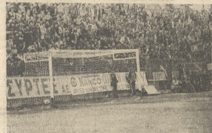
Ο ΑΓΩΝΑΣ ΑΡΧΙΖΕΙ

ΞΕΠΕΡΑΣΕ και το εμπόδιο του Πανσερραϊκού ο ΟΦΗ τόν οποίο νίκησε με σκορ 2-0 και τώρα ανήκει στο γκρουπ των ομάδων που δεν αγωνιούν για το μέλλον, αλλά αντίθετα αγωνίζονται για να καταλάβουν μιά καλύτερη θέση στον βαθμολογικό πίνακα. Το μάτς έγινε κάτω από ιδανικές καιρικές συνθήκες και μέσα σε μιά ατμόσφαιρα που μπορεί να χαρακτηριστεί ακόμη και φιλική. Μοναδικό μελανό σημείο ή ενέργεια του «φιλάθλου» που πέταξε τήν κροτίδα στον αγωνιστικό χώρο, λίγο δε έλλειψε να τυφλώσει τόν έποπτη γραμμών κ. Λέζο. Ανεξήγητη ή στάση των «φιλάθλων» που πετούν τις κροτίδες, αλλά εξ ίσου ανεξήγητη και ή στάση αυτών που κάθονται δίπλα τους και οι οποίοι δεν τούς πιάγουν από τό αυτί για να τούς παραδώσουν στην Χυροφυλακή, προκειμένου να πληρώσουν κατά τά έργα τους. Από πλευράς αγωνιστικής πρέπει να δηλολογήσωμε ότι οι φιλάθλοι δεν ίκα νοποιήθηκαν πλήρως γιατί τό δεύτερο γκόλ άργησε να έλθει και έτσι τό καρδιοχτύπι δεν έλλειψε. Άς δούμε όμως, πώς εξέλιχθηκε τό μάτς αυτό που συγκέντρωσε τό ενδιαφέρον των φιλάθλων του Ηρακλείου.