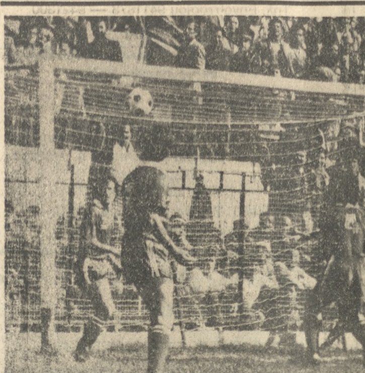
Απο ένστικτη ο Σκούνας δά άποκρούσει τή μπάλλα σε κεφαλιά του Αγιομαμίτη (δεξιά). Έχει προηγηθεί κόρνερ του Κορωνάκη. Παραδόξως ο διαιτητής έξ δώσε άουτ, ενώ φαίνεται καθαρά ότι ο Αγιομαμίτης έρίσκει μέσα στον αγωνιστικό χώρο. Φωτ'ιτάζ: ΔΡΟΣΟΣ - ΤΡΙΚΟΥΡΑΚΗΣ - ΛΙΟΝΤΟΣ 221830