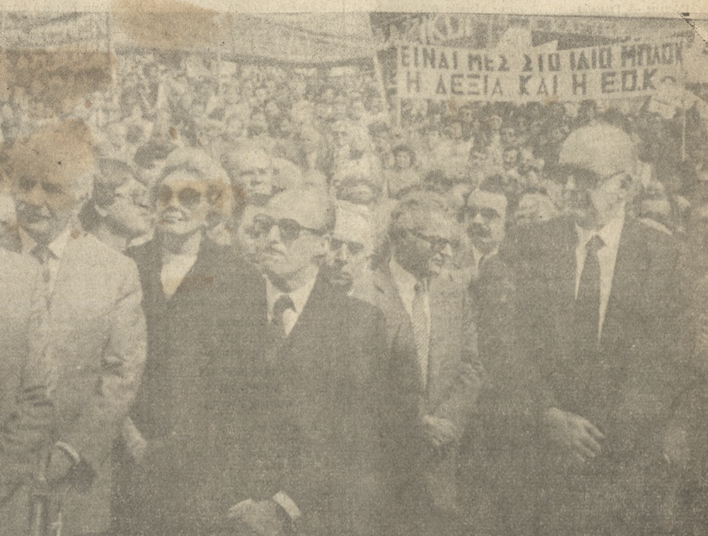
Ο Πρωθυπουργός κ. Α. Παπανδρέου στη Λαοθάλασσα του Κιλελέρ. Σε πρώτο πλάνο, επίσης, ο Γεν. Γραμματέας του Κ.Κ.Ε. κ. Χαρ. Φλωράκης, η κ. Μαργαρίτα Παπανδρέου κ. ά.

Οι τραπεζίες αρνούνται χρηματοδότηση μικρομεσαίων: Στον Υπουργό Συντονισμού κ. Λάζαρο, ο Ήμιερικός Σύλλογος Ήρακλείου έστειλε το παρακάτω τηλεγράφημα: «Εμπορικός κόσμος Ήρακλείου ανόστατος από άρνηση τραπεζών υλοποίησης αποφάσεως για χρηματοδότηση μικρομεσαίων επιχειρήσεων. Προτάσεις μελών Συλλόγου μας για κατάλληλη τραπεζική μελετούνται. Εμπορικός Σύλλογος Ήρακλείου» Για να χτίσουμε μία Ελλάδα έθνικά περήφανη και κοινωνικά δίκαιη. Μετά τον λόγο του κ. πρωθυπουργού ένεκερη ψήφισμα το οποίο αφού καταδικάζει τη «άντιαγορτική» πολιτική της δεξιάς καλείται η αγροτιά να διατηρήσει ζωντανό το δόγμα του Κιλελέρ. Ο Γ. Γ. ΦΩΛΡΑΚΗΣ Κ. Χ. ΤΟΥΡΑΚΗΣ Στη συνέχεια μίλησε ο Γ.Γ. του ΚΚΕ κ. Φλωράκης ο οποίος