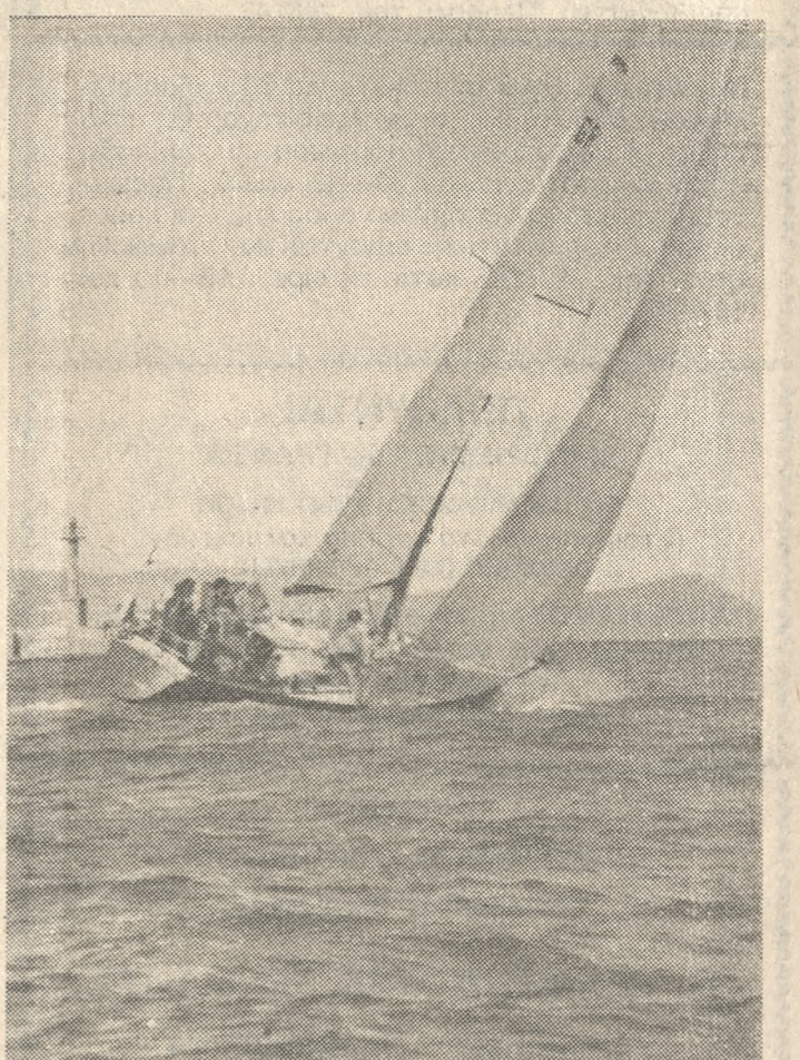
Όπως γράψαμε και χθες ο Ναυτικός Όμιλος Ηρακλείου (Ν.Ο.Η.) σε συνεργασία με τον Πανελλήνιο Όμιλο Ιστιοπλοΐας Άνοιχτής Θάλασσας (ΠΟΙΑΘ), διεργάνωσε για δεύτερη φορά Σχολή Ιστιοπλοΐας Άνοιχτής Θάλασσας. Τη Σχολή, της οποίας τα μαθήματα άρχισαν στις 14 Μαρτίου και θα τελειώσουν στις 10 Απριλίου, παρακολουθούν 18 άτομα. Εκπαιδευτές είναι ο κ. Εμμ. Παναγιώτης, ιδιοκτήτης του οποίου είναι και το κίερως «ΟΝΕΠΙΟ 2», που φηνείται στη φωτογραφία μας, με το όπείο εκπαιδευούνται οι 18 Ηρακλειώτες. Οσοσδήποτε πρόκειται για μία προσεφέρα του Ν.Ο.Η., άξια συγχαρητήριων.

15.000 μ. Παιδών: Ι. Παπαδάκης 34,9 Εμμ. Παχυμιανόκη Ν. Κουμπενάκης Απ. Σαλιτζής Ηλ. Καρύδης Α. Παπαδάκης