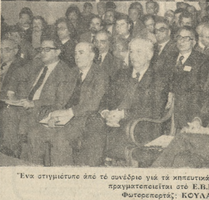
Ένα στιγμιότυπο από τό συνέδριο για τά κηπευτικά και άνθη υπό κάλυψη που πραγματοποιείται στο Ε.Β.Ε.Η.

κ. Γεωργόπουλος, θα γίνουν δε εισηγήσεις από τούς κ.κ. Θανάσοπουλο, Μπακαλάκη, Βασιλείου, Μαλαθράκη, Σωρή, Κορνάρου, Τζάμο, Βακαλοπούλη, Αγγελή, Μπέρη, Ρούμιο, Πυροβόλη, Ροδιτάκη, Μιχαήλη, Χατζηνικόλη, Γερακόπουλο, Παράδλη.