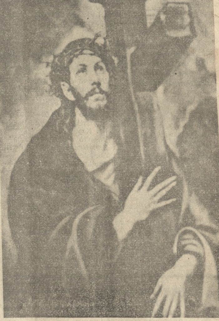
Σήμερον κρεμάται έπι ξύλου ό έν ύδασι την γήν κρεμάσας.