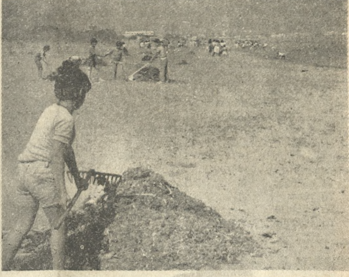
ΜΑΘΗΤΕΣ ΚΑΘΑΡΙΖΟΥΝ ΤΙΣ ΑΚΤΕΣ Με πρωτοβουλία του Εκπαιδευτικού Συλλόγου Καμινίων μαθητές του Δημοτικού Σχολείου της περιοχής καθάρισαν τις ακτές στο Λίντο. Χαρακτηριστικό είναι το παραπάνω στιγμιότυπο.

Με μεγάλη επιτυχία πραγματοποιήθηκε χθες βράδυ στην Βασιλική του Αγ. Μάρκου η έκδηλωση τιμής στη μνήμη του άξιου νικητή Γρηγόρη Λαμπράκη που οργάνωσε το τοπικό παράρτημα της Ελληνικής Επιτροπής για την Διεθνή Ύψωση και Ειρήνη. Η εκδήλωση έγινε στο πλαίσιο του 10ήμερου της Ειρήνης και στη διάρκεια της προβλήθηκε η αντιπολεμική ταινία του Μ. Ρώμ «Ο Αληθινός Φασισμός».