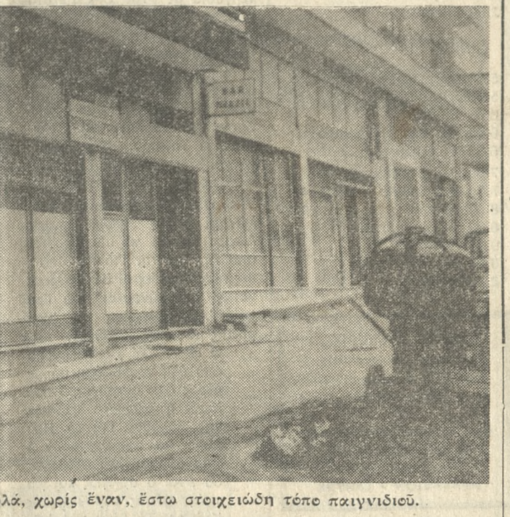
«Νηπιαγωγείο» με ρολόι, χωρίς έδαφος, εστω στοιχειώδη τόπο παιχνιδιού.