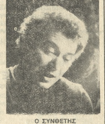
Ο ΣΥΝΘΕΤΗΣ ΓΙΩΡΓΟΣ ΚΡΙΜΙΖΑΚΗΣ

Το δημοκρατικό και πνευματικό 'Ηρακλείο μέσα από το Διδακτικό Συμβούλιο και το Δήμαρχο του κ. Καρέλλη τιμά αύριο βράδυ τον πνευματικό άνθρωπο, το μεγάλο οραματιστή και στοχαστή, τον ποιητή Γιάννη Κουτσοχέρα.