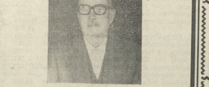
ΜΥΡΩΝ Ι. ΙΕΡΩΝΥΜΙΔΗ και παρακαλούμε τούς συγγενείς και φίλους όπως παραστούν. Η σύζυγος: Αμαλία Ιερωνυμιδή. Τά παιδιά — οι άδελφοί. Τά έγγονα — οι λοιποί συγγενείς.

Τελούμε τό Σάββατο 12-6-82 και ώρα 8,30 π.μ. στον Ι.Ν. Αγ. Χαράλαμπος Κρουσιώνα, 40θήμερο μνημόσυνο υπέρ αναπασιεως της ψυχής του αγαπημένου μας