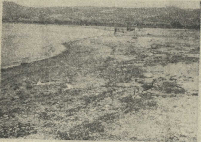
Πολλή η δουλειά που μπαίνει στον Σύνδεσμο (εύγλωττη και πάλη η φωτογραφία μας καθώς ο φακός «βουτά» στην «πλάση» της Φλω...