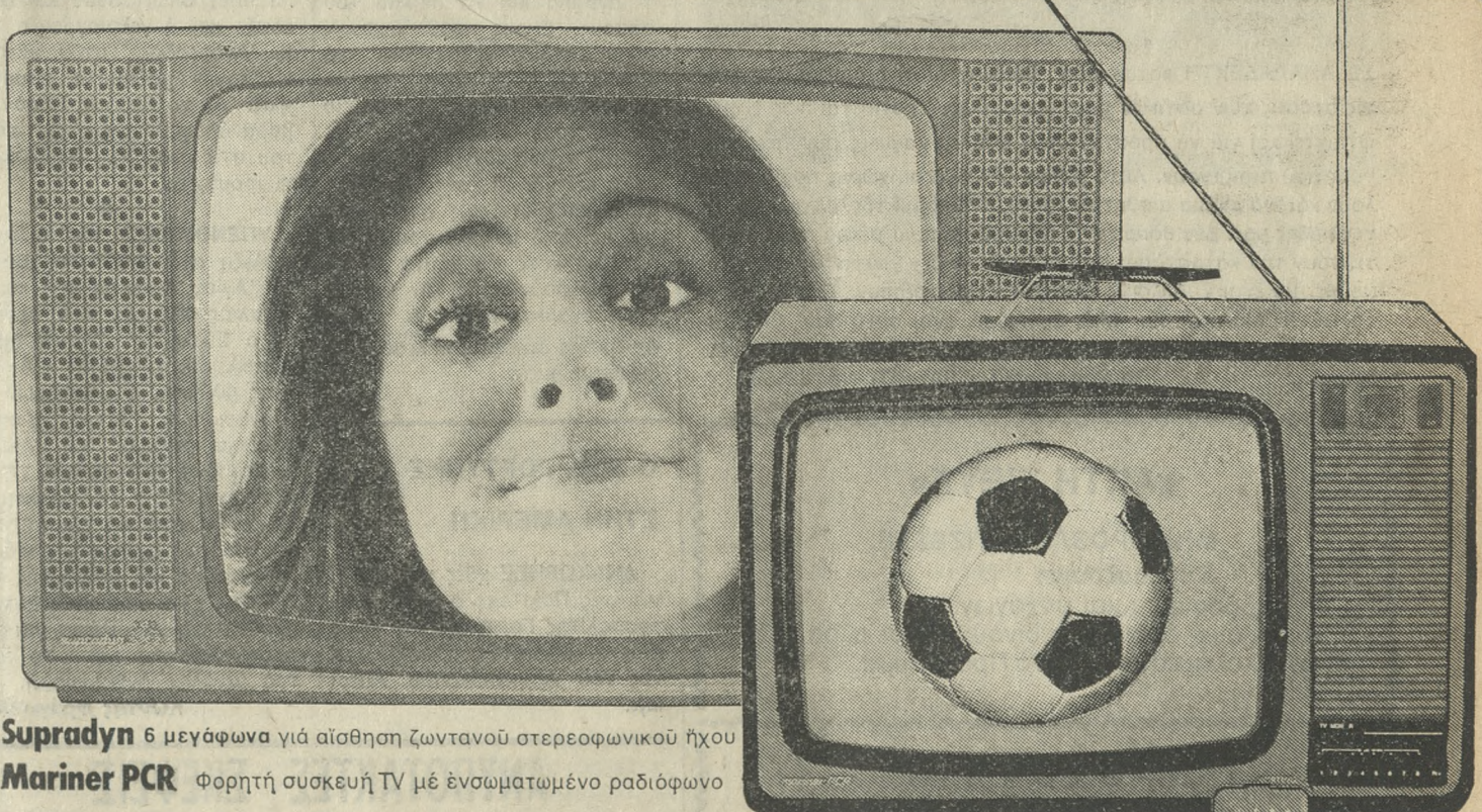
Supradyn 6 μεγάφωνα για αίσθηση ζωντανού στερεοφωνικού ήχου Mariner PCR Φορητή συσκευή TV με ενσωματωμένο ραδιόφωνο

ἡ körting ἀνταποκρίνεται στήν ἐπιθυμία σας γιά: