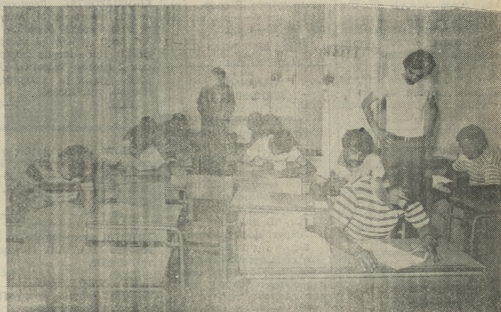
Οἱ ὑποψήφιοι διαιτητῆς τοῦ μπάσκετ τὴν ὥρα τῆς γραπτῆς δοκιμασίας.

Ὅσοι ὑποψήφιοι πετύχουν στὶς ἐξετάσεις θὰ ὀνομαστοῦν Δοκιμοὶ διαιτητῆς καὶ θὰ μεπορὺν νὰ διαιτητοῦσαν γιὰ ἐνα χρόνο. Κατῶν σύμφωνα μὲ τὶς διατάξεις τοῦ ἀρθροῦ 12 τοῦ ἐσωτερικοῦ Κανονισμοῦ τῆς ΟΔΚΕ θὰ γίνον διαιτητῆς.