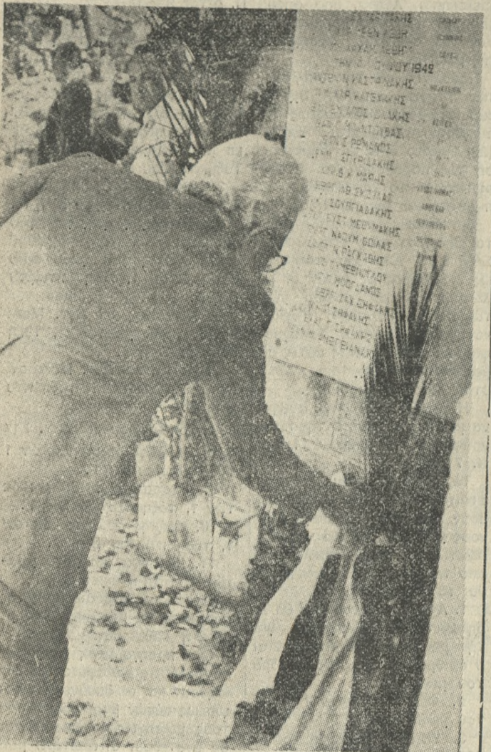
Ο Υπουργός Οικονομικών κ. Δρεττάκης αντιπροσώπευσε την Κυβέρνηση στο μνημόσυνο 62 Μαρτύρων που έγινε την Κυριακή στο Γάζι...